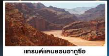
แกรนด์แคนยอนอาตุซื่อ