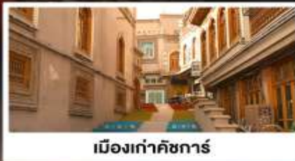
เมืองเก่าคัชการ์