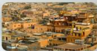
เมืองเก่าคัชการ