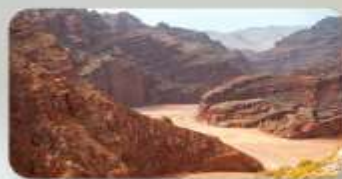
แกรนด์แคนยอนอาตุซื่อ