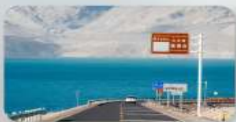
ทะเลสาบไป่ซาหู