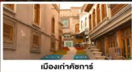
เมืองเก่าคัชการ์