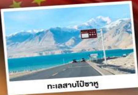
ทะเลสาบเปีซาหู่