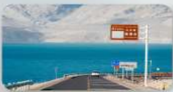
ทะเลสาบไป่ซาหู