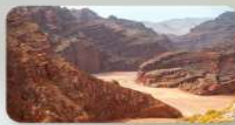
แกรนด์แคนยอนอาตุซื่อ