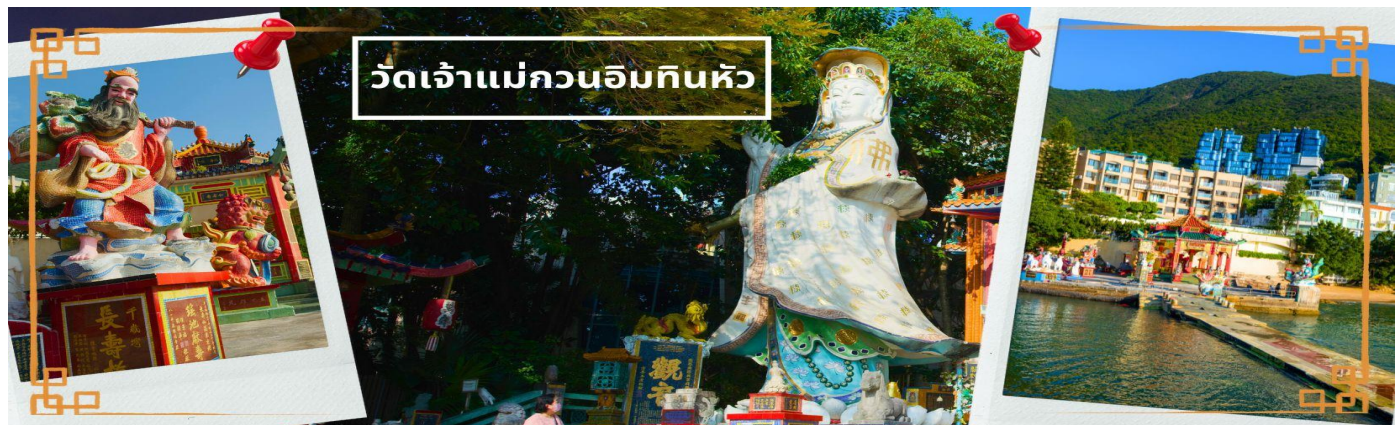
วัดเจ้าแม่กวนอิมหินขาว

จากนั้นนำท่านเดินทางสู่ วัดเจ้าแม่กวนอิมหินขาว อ่าวรีพัลส์เบย์ (TIN HAU TEMPLE REPULSE BAY) ตั้งอยู่ริมทะเล เป็นสถานที่ท่องเที่ยวสำคัญ สร้างขึ้นในปี ค.ศ.1993 วัดแห่งนี้ถูกสร้างขึ้นเพื่อคุ้มครองชาวประมงในการออกไปหาปลา ซึ่งเป็นหนึ่งในวัดที่เก่าแก่ที่สุดของฮ่องกง บริเวณวัดจะมี เจ้าแม่กวนอิมองค์ใหญ่ ประดิษฐานพระตั้งอยู่เป็นเทพที่ชาวฮ่องกงและคนจีนให้ความเคารพนับถือมากที่สุด สามารถขอพรได้ทุกเรื่อง วัดนี้เป็นที่นิยมมีนักท่องเที่ยวเดินทางมาขอพรกันมากมาย เพราะเชื่อในความศักดิ์สิทธิ์ และยังมีเจ้าแม่ทับทิม หรือเทพธิดาแห่งท้องทะเลองค์ใหญ่ ซึ่งคนฮ่องกง คนมาเก๊า และคนจีน ที่อยู่ริมทะเล ชาวประมง นักเดินเรือหรือผู้ที่เดินทางทางเรือเป็นประจำ จะนับถือ