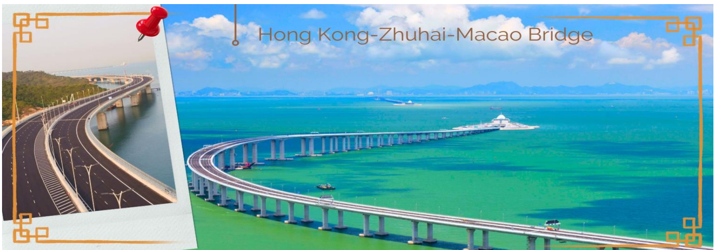
CHXH9 ฮองกง-มาเก๊าเดย์ทัวร์ เที่ยวจุใจ 4วัน2คืน สายการบิน Hongkong Airlines (Jun-Oct' 26)

มาเก๊า มีชื่อทางการว่า เขตบริหารพิเศษมาเก๊าแห่งสาธารณรัฐประชาชนจีน เป็นพื้นที่บนชายฝั่งทางใต้ของประเทศจีน เป็นเขตปกครองพิเศษของจีน โดยมีฐานะเป็น เขตบริหารพิเศษภายใต้หลักการ หนึ่งประเทศสองระบบ ผู้ที่อาศัยอยู่ในมาเก๊าส่วนใหญ่พูดภาษากวางตุ้งเป็นภาษาแม่ ภาษาจีนกลาง ภาษาโปรตุเกส และภาษาอังกฤษ ชาวมาเก๊า มี