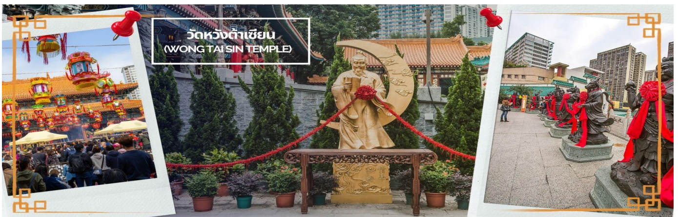
CHXH9 ฮ่องกง-มาเก๊าเคยท์ัวร์ เที่ยวจุใจ 4วัน2คืน สายการบิน Hongkong Airlines (Jun-Oct' 26)

จากนั้นนำท่านเดินทางสู่ วัดหวังต้าเซียน (WONG TAI SIN TEMPLE) เป็นวัดเก่าแก่อายุกว่าร้อยปี (คนจีนกว้างตั้งจะเรียกวัดนี้ว่า หว่องไท่ซิน) ซึ่งวัดแห่งนี้เป็นที่ประดิษฐานของเทพเจ้าจีนหลายองค์ เทพเจ้าหลักของวัดคือเทพหวังต้าเซียน ท่านเทพเจ้าหวังต้าเซียน ชื่อเดิมคือ “หว่องซ้อเผ่ง” เป็นมนุษย์ธรรมดา เป็นเด็กเลี้ยงแพะที่มีความกตัญญูต่อ