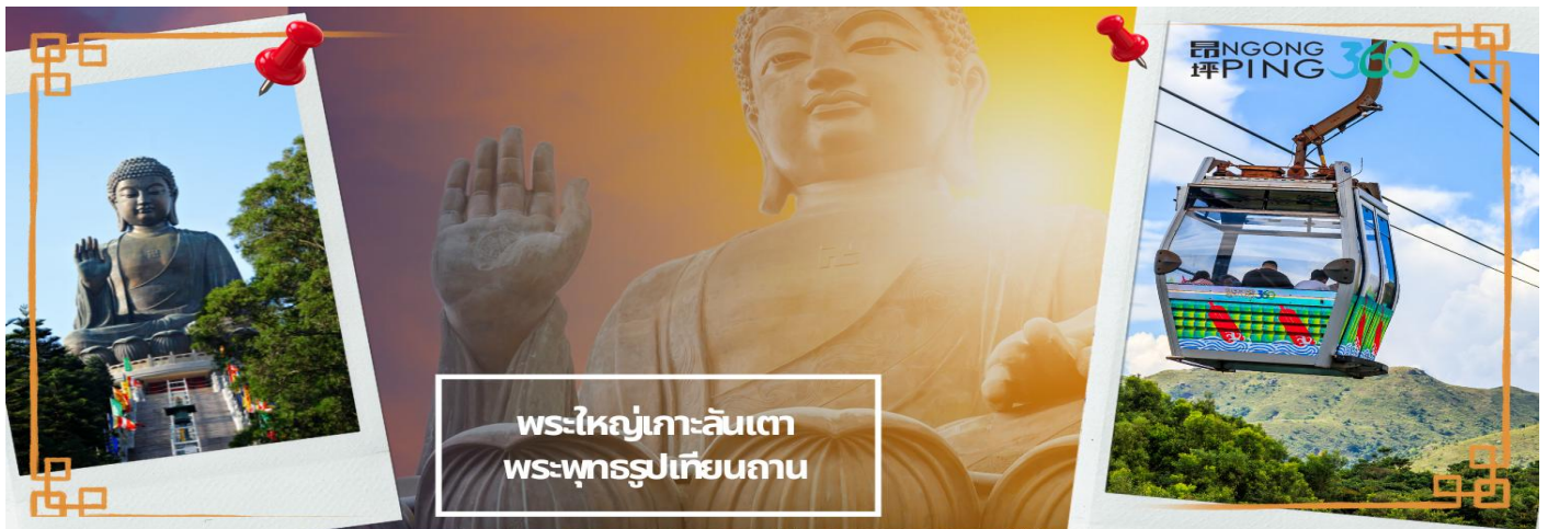
พระใหญ่เกาะลันเตา พระพุทธรูปเทียนถาน

จากนั้นเดินทางสู่เกาะลันเตา เพื่อไปที่สถานีต่งซุง ท่านจะได้สัมผัสกับประสบการณ์ที่น่าตื่นตาตื่นใจจาก กระเช้าลอยฟ้ามองปิง (NGONG PING SKYRAIL 360 **รวมบัตร STANDARD CABIN**) ซึ่งถือได้ว่าเป็นแหล่งท่องเที่ยวอันมีเอกลักษณ์ระดับโลกของฮ่องกง ที่มีระยะทางกว่า 5.7 กิโลเมตร ใช้เวลาประมาณ 25 นาที ท่านจะได้สัมผัสบรรยากาศจากบนกระเช้ามุมสูง เส้นทางกระเช้าเชื่อมจากใจกลางเมืองต่งซุง ถึง หมู่บ้านวัฒนธรรมมองปิง บนเกาะลันเตา ท่านจะได้ชมวิวแบบพาโนรามา 360 องศา ของสนามบินนานาชาติฮ่องกง ทิวทัศน์เหนือท้องทะเลของทะเลจีนใต้ ชมวิวของเนินเขาอันเขียวขจี น้ำตก ลำธาร และป่าอันเขียวชอุ่มของอุทยานบนเกาะลันเตาเหนือ (**กรณีกระเช้ามองปิง 360 มีการปิดซ่อมบำรุง หรือ มีการปิดเนื่องจากสภาพอากาศแปรปรวน ทางบริษัทฯ ขอสงวนสิทธิ์ในการเปลี่ยนเป็นใช้รถไฟชานเมืองของการเดินทาง เพื่อนำท่านขึ้นสู่หมู่บ้านวัฒนธรรมมองปิง บนเกาะลันเตาแทน**)