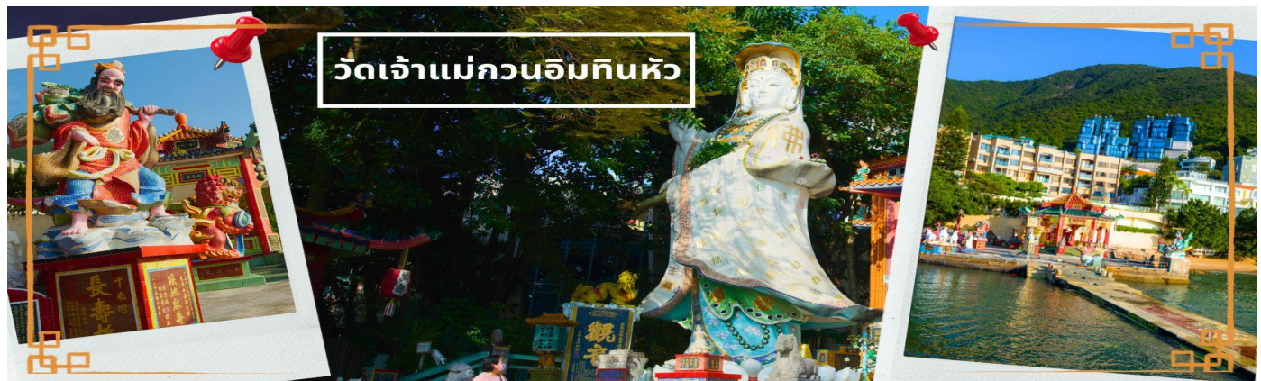
วัดเจ้าแม่กวนอิมหินหัว

เช้า 🍲 บริการอาหารเช้า ณ ภัตตาคาร **เมนูติ่มซำต้นตำหรับฮ่องกง** (3) จากนั้นนำท่านเดินทางสู่ วัดเจ้าแม่กวนอิมหินหัว อ่าวรีพลัสเบย์ (TIN HAU TEMPLE REPULSE BAY) ตั้งอยู่ริมทะเล เป็นสถานที่ท่องเที่ยวสำคัญ สร้างขึ้นในปี ค.ศ.1993 วัดแห่งนี้ถูกสร้างขึ้นเพื่อคุ้มครองชาวประมงในการออกเรือไปหาปลา ซึ่งเป็นหนึ่งในวัดที่เก่าแก่ที่สุดของฮ่องกง บริเวณวัดจะมี เจ้าแม่กวนอิมองค์ใหญ่ ประดับประทานพรตั้งอยู่เป็นเทพที่ชาวฮ่องกงและคนจีนให้ความเคารพนับถือมากที่สุด สามารถขอพรได้ทุกเรื่อง วัดนี้เป็นที่นิยมมีนักท่องเที่ยวเดินทางมาขอพรกันมากมาย เพราะเชื่อในความศักดิ์สิทธิ์ และยังมี เจ้าแม่ทับทิม หรือเทพิตาแห่งท้องทะเลองค์ใหญ่ ซึ่งคนฮ่องกง คนมาเก๊า และคนจีน ที่อยู่ริมทะเล ชาวประมง นักเดินเรือหรือผู้ที่เดินทางทางเรือเป็นประจำ จะนับถือ