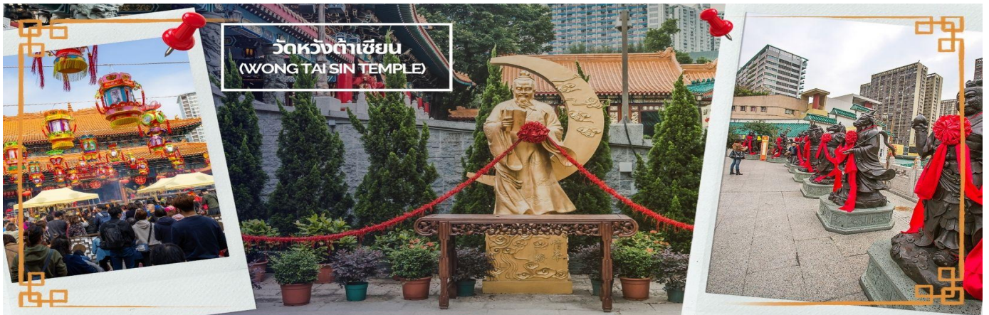
CHXH9 ฮ่องกง-มาเก๊าเคยท์ัวร์ เที่ยวจุใจ 4วัน2คืน สายการบิน Hongkong Airlines (Jun-Oct' 26)

จากนั้นนำท่านเดินทางสู่ วัดหวังต้าเซียน (WONG TAI SIN TEMPLE) เป็นวัดเก่าแก่อายุกว่าร้อยปี (คนจีนกว้างตุ้งจะเรียกวัดนี้ว่า หว่องไท่ซิน) ซึ่งวัดแห่งนี้เป็นที่ประดิษฐานของเทพเจ้าจีนหลายองค์ เทพเจ้าหลักของวัดคือเทพหวังต้าเซียน ท่านเทพเจ้าหวังต้าเซียน ชื่อเดิมคือ “หว่องซ้อเผ่ง” เป็นมนุษย์ธรรมดา เป็นเด็กเลี้ยงแพะที่มีความกตัญญูต่อ