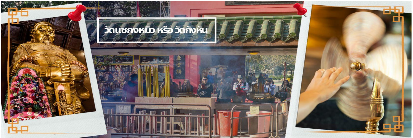
วัดแชกงหม้อ หรือ วัดกังหัน

พลอันกล้าหาญแข็งแกร่งของแม่ทัพแชกง เป็นวัดเก่าแก่ที่มีความศักดิ์สิทธิ์มาก มีอายุกว่า 300 ปีตั้งอยู่ในเขต SHATIN มีประวัติเล่าต่อกันมาว่า ขณะที่แม่ทัพปราบศึกอยู่นั้น ทุกแคว้นเขตแดนแผ่นดินใหญ่ต่างก็ยำเกรงต่อกำลังพลที่