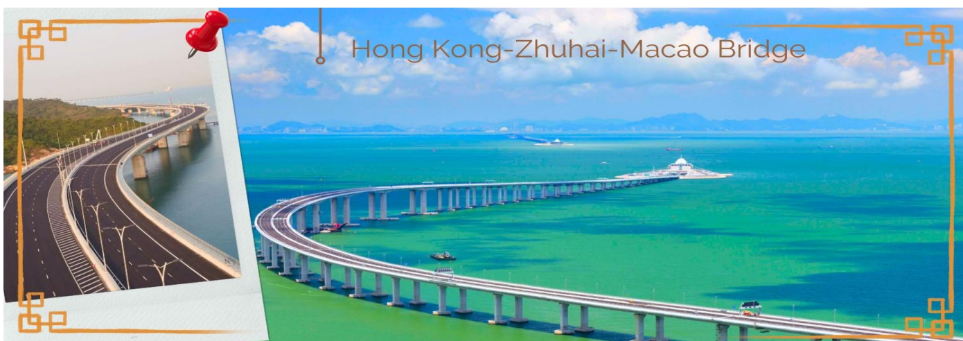
CHXH9 ฮองกง-มาเก๊าเดย์ทัวร์ เที่ยวจุใจ 4วัน2คืน สายการบิน Hongkong Airlines (Jun-Oct' 26)

02.40 น. นำท่านเดินทางสู่ ฮองกง โดยสายการบิน HONG KONG AIRLINES (HX) เที่ยวบินที่ HX768 07.00 น. เดินทางถึงสนามบินเซ็กแล็บก๊อ เขตปกครองพิเศษฮองกง นำทุกท่านเข้าพิธีการตรวจคนเข้าเมืองหลังจากผ่านพิธีการตรวจคนเข้าเมืองเป็นที่เรียบร้อยแล้ว รับกระเป๋าสัมภาระ และเดินทางโดยรถโค้ชปรับอากาศ **โปรดทราบ เวลาท้องถิ่นที่ฮองกงเร็วกว่าประเทศไทย 1 ชั่วโมง กรุณาปรับนาฬิกาให้ตรงกับเวลาท้องถิ่น เพื่อความสะดวกในการนัดเวลานะคะ** อธิระให้ท่านแวะทำธุระส่วนตัวตามอัธยาศัย หลังจากทำธุระส่วนตัวเป็นที่เรียบร้อยแล้ว นำกระเป๋าสัมภาระส่วนตัว และเดินทางโดยรถโค้ชปรับอากาศ (สัมภาระฝากไว้ที่รถ) นำท่านเดินทางสู่ มาเก๊า (MACAU) หรือ เอ้าเหมิน (รถโค้ชปรับอากาศ) ด้วยการเดินทางผ่านเส้นทางสะพาน Hong kong – Zhuhai – Macao Bridge สะพานมีความยาว 55 กิโลเมตร ซึ่งเป็นสะพานข้ามทะเลที่ยาวที่สุดในโลก สะพานดังกล่าวเปิดใช้งาน เมื่อวันที่ 23 ต.ค. 2561 ซึ่งเชื่อมระหว่างเขตบริหารพิเศษฮองกง กับเมืองจูไห่ของมณฑลกวางตุ้ง และเขตบริหารพิเศษมาเก๊าของจีน โดยสะพานเส้นทางนี้นับเป็นครั้งแรก ที่จะช่วยลดระยะเวลาการเดินทางจากฮองกงไปยังจูไห่และมาเก๊า จากเดิม 3 ชั่วโมง ให้เหลือเพียงภายใน 1 ชั่วโมง มาเก๊า มีชื่อทางการว่า เขตบริหารพิเศษมาเก๊าแห่งสาธารณรัฐประชาชนจีน เป็นพื้นที่บนชายฝั่งทางใต้ของประเทศจีน เป็นเขตปกครองพิเศษของจีน โดยมีฐานะเป็น เขตบริหารพิเศษภายใต้หลักการ หนึ่งประเทศสองระบบ ผู้ที่อาศัยอยู่ในมาเก๊าส่วนใหญ่พูดภาษากวางตุ้งเป็นภาษาแม่ ภาษาจีนกลาง ภาษาโปรตุเกส และภาษาอังกฤษ ชาวมาเก๊า มี