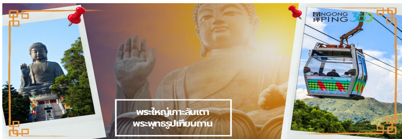
พระใหญ่เกาะลันเตา พระพุทธรูปเทียนถาน

จากนั้นเดินทางสู่เกาะลันเตา เพื่อไปที่สถานีตุงซุง ท่านจะได้สัมผัสกับประสบการณ์ที่น่าตื่นตาตื่นใจจาก กระเช้าลอยฟ้ามองปิง (NGONG PING SKYRAIL 360 **รวมบัตร STANDARD CABIN**) ซึ่งถือได้ว่าเป็นแหล่งท่องเที่ยวอันมีเอกลักษณ์ระดับโลกของฮ่องกง ที่มีระยะทางกว่า 5.7 กิโลเมตร ใช้เวลาประมาณ 25 นาที ท่านจะได้สัมผัสบรรยากาศจากบนกระเช้ามุมสูง เส้นทางกระเช้าเชื่อมจากใจกลางเมืองตุงซุง ถึง หมู่บ้านวัฒนธรรมมองปิง บนเกาะลันเตา ท่านจะได้ชมวิวแบบพาโนรามา 360 องศา ของสนามบินนานาชาติฮ่องกง ทิวทัศน์เหนือท้องทะเลของทะเลจีนใต้ ชมวิวของเนินเขาอันเขียวขจี น้ำตก ลำธาร และป่าอันเขียวชอุ่มของอุทยานบนเกาะลันเตาเหนือ (**กรณีกระเช้ามองปิง 360 มีการปิดซ่อมบำรุง หรือ มีการปิดเนื่องจากสภาพอากาศแปรปรวน ทางบริษัทฯ ขอสงวนสิทธิ์ในการเปลี่ยนเป็นใช้รถโค้ชของทางอุทยานในการเดินทาง เพื่อนำท่านขึ้นสู่หมู่บ้านวัฒนธรรมมองปิง บนเกาะลันเตาแทน**)