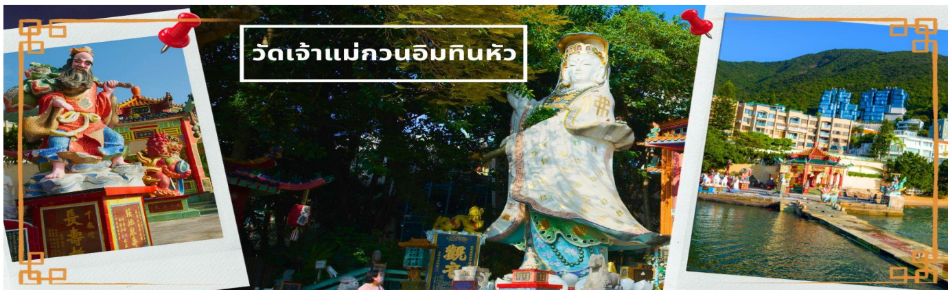
วัดเจ้าแม่กวนอิมหินขาว

จากนั้นนำท่านเดินทางสู่ วัดเจ้าแม่กวนอิมหินขาว อ่าวรีพลัสเบย์ (TIN HAU TEMPLE REPULSE BAY) ตั้งอยู่ริมทะเล เป็นสถานที่ท่องเที่ยวสำคัญ สร้างขึ้นในปี ค.ศ.1993 วัดแห่งนี้ถูกสร้างขึ้นเพื่อคุ้มครองชาวประมงในการออกเรือไปหาปลา ซึ่งเป็นหนึ่งในวัดที่เก่าแก่ที่สุดของฮ่องกง บริเวณวัดจะมี เจ้าแม่กวนอิมองค์ใหญ่ ประดิษฐานพระตั้งอยู่เป็นเทพที่ชาวฮ่องกงและคนจีนให้ความเคารพนับถือมากที่สุด สามารถขอพรได้ทุกเรื่อง วัดนี้เป็นที่นิยมมีนักท่องเที่ยวเดินทางมาขอพรกันมากมาย เพราะเชื่อในความศักดิ์สิทธิ์ และยังมีเจ้าแม่ทับทิม หรือเทพิตาแห่งท้องทะเลองค์ใหญ่ ซึ่งคนฮ่องกง คนมาเก๊า และคนจีน ที่อยู่ริมทะเล ชาวประมง นักเดินเรือหรือผู้ที่เดินทางทางเรือเป็นประจำ จะนับถือ