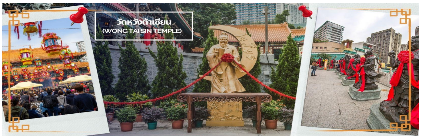
CHXH9 ฮ่องกง-มาเก๊าเคยท์ัวร์ เที่ยวจุใจ 4วัน2คืน สายการบิน Hongkong Airlines (Jun-Oct' 26)

จากนั้นนำท่านเดินทางสู่ วัดหวังต้าเซียน (WONG TAI SIN TEMPLE) เป็นวัดเก่าแก่อายุกว่าร้อยปี (คนจีนกว้างตุ้งจะเรียกวัดนี้ว่า หว่องไท่ซิน) ซึ่งวัดแห่งนี้เป็นที่ประดิษฐานของเทพเจ้าจีนหลายองค์ เทพเจ้าหลักของวัดคือเทพหวังต้าเซียน ท่านเทพเจ้าหวังต้าเซียน ชื่อเดิมคือ “หว่องซ้อเผ่ง” เป็นมนุษย์ธรรมดา เป็นเด็กเลี้ยงแพะที่มีความกตัญญูต่อ