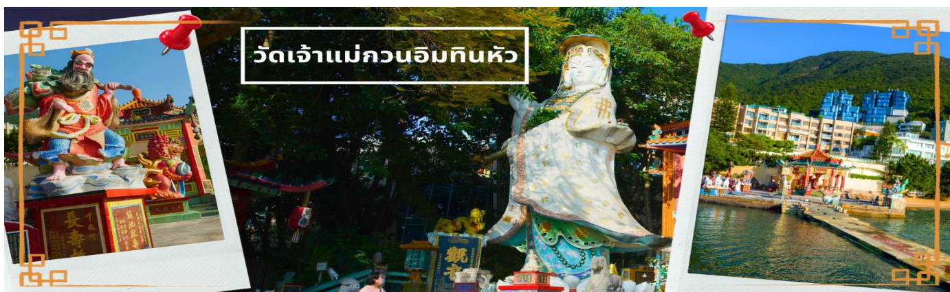
วัดเจ้าแม่กวนอิมหินหัว

จากนั้นนำท่านเดินทางสู่ วัดเจ้าแม่กวนอิมหินหัว อ่าวรีพลัสเบย์ (TIN HAU TEMPLE REPULSE BAY) ตั้งอยู่ริมทะเล เป็นสถานที่ท่องเที่ยวสำคัญ สร้างขึ้นในปี ค.ศ.1993 วัดแห่งนี้ถูกสร้างขึ้นเพื่อคุ้มครองชาวประมงในการออกเรือไปหาปลา ซึ่งเป็นหนึ่งในวัดที่เก่าแก่ที่สุดของฮ่องกง บริเวณวัดจะมี เจ้าแม่กวนอิมองค์ใหญ่ ประดิษฐานพระตั้งอยู่เป็นเทพที่ชาวฮ่องกงและคนจีนให้ความเคารพนับถือมากที่สุด สามารถขอพรได้ทุกเรื่อง วัดนี้เป็นที่นิยมมีนักท่องเที่ยวเดินทางมาขอพรกันมากมาย เพราะเชื่อในความศักดิ์สิทธิ์ และยังมีเจ้าแม่ทับทิม หรือเทพิตาแห่งท้องทะเลองค์ใหญ่ ซึ่งคนฮ่องกง คนมาเก๊า และคนจีน ที่อยู่ริมทะเล ชาวประมง นักเดินเรือหรือผู้ที่เดินทางทางเรือเป็นประจำ จะนับถือ