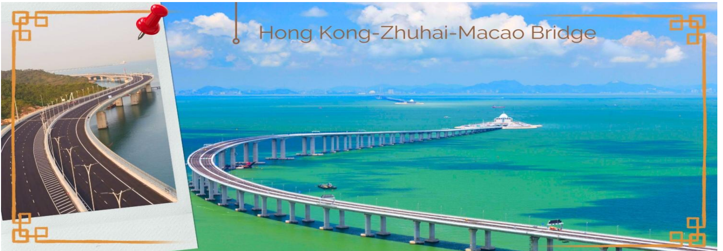
CHXH9 ฮองกง-มาเก๊าเดย์ทัวร์ เที่ยวจุใจ 4วัน2คืน สายการบิน Hongkong Airlines (Jun-Oct' 26)

วันสอง กรุงเทพ สุวรรณภูมิ- ฮองกง (สนามบินเซ็กเล้งก๊อ) – เที่ยวมาเก๊าแบบวันเดย์ทัวร์ ไปเช้า-กลับเย็น 02.40 น. นำท่านเดินทางสู่ ฮองกง โดยสายการบิน HONG KONG AIRLINES (HX) เที่ยวบินที่ HX768 07.00 น. เดินทางถึงสนามบินเซ็กเล้งก๊อ เขตปกครองพิเศษฮองกง นำทุกท่านเข้าพิธีการตรวจคนเข้าเมืองหลังจากผ่านพิธีการตรวจคนเข้าเมืองเป็นที่เรียบร้อยแล้ว รับกระเป๋าสัมภาระ และเดินทางโดยรถโค้ชปรับอากาศ **โปรดทราบ เวลาท้องถิ่นที่ฮองกงเร็วกว่าประเทศไทย 1 ชั่วโมง กรุณาปรับนาฬิกาให้ตรงกับเวลาท้องถิ่น เพื่อความสะดวกในการนัดเวลานะคะ** อธิระให้ท่านแวะทำธุระส่วนตัวตามอัธยาศัย หลังจากทำธุระส่วนตัวเป็นที่เรียบร้อยแล้ว นำกระเป๋าสัมภาระส่วนตัว และเดินทางโดยรถโค้ชปรับอากาศ (สัมภาระฝากไว้ที่รถ)นำท่านเดินทางสู่ มาเก๊า (MACAU) หรือ เอ้าเหมิน (รถโค้ชปรับอากาศ) ด้วยการเดินทางผ่านเส้นทางสะพาน Hong kong – Zhuhai – Macao Bridge สะพานมีความยาว 55 กิโลเมตร ซึ่งเป็นสะพานข้ามทะเลที่ยาวที่สุดในโลก สะพานดังกล่าวเปิดใช้งาน เมื่อวันที่ 23 ต.ค. 2561 ซึ่งเชื่อมระหว่างเขตบริหารพิเศษฮองกง กับเมืองจูไห่ของมณฑลกวางตุ้ง และเขตบริหารพิเศษมาเก๊าของจีน โดยสะพานเส้นทางนี้นับเป็นครั้งแรก ที่จะช่วยลดระยะเวลาการเดินทางจากฮองกงไปยังจูไห่และมาเก๊า จากเดิม 3 ชั่วโมง ให้เหลือเพียงภายใน 1 ชั่วโมง มาเก๊า มีชื่อทางการว่า เขตบริหารพิเศษมาเก๊าแห่งสาธารณรัฐประชาชนจีน เป็นพื้นที่บนชายฝั่งทางใต้ของประเทศจีน เป็นเขตปกครองพิเศษของจีน โดยมีฐานะเป็น เขตบริหารพิเศษภายใต้หลักการ หนึ่งประเทศสองระบบ ผู้ที่อาศัยอยู่ในมาเก๊าส่วนใหญ่พูดภาษากวางตุ้งเป็นภาษาแม่ ภาษาจีนกลาง ภาษาโปรตุเกส และภาษาอังกฤษ ชาวมาเก๊า มี