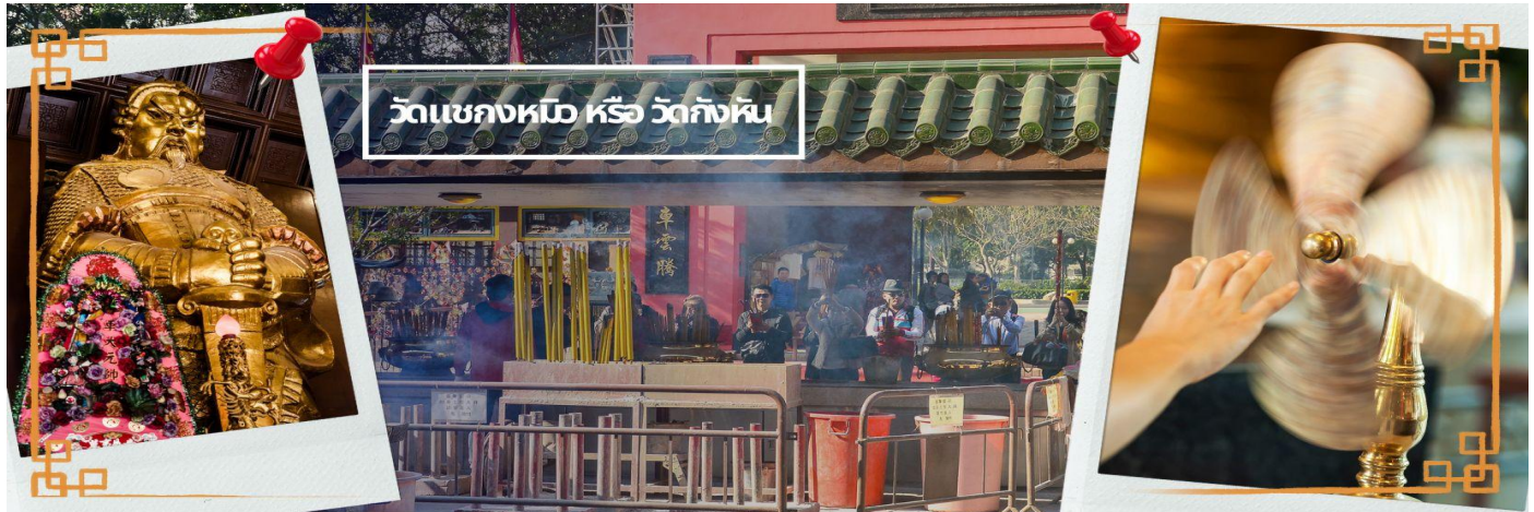
วัดเซี่ยงหนิว หรือ วัดกังหัน

พลอันกล้าหาญแข็งแกร่งของแม่ทัพเซี่ยง เป็นวัดเก่าแก่ที่มีความศักดิ์สิทธิ์มาก มีอายุกว่า 300 ปีตั้งอยู่ในเขต SHATIN มีประวัติเล่าต่อกันมาว่า ขณะที่แม่ทัพปราบศึกอยู่นั้น ทุกแคว้นเขตแดนแผ่นดินใหญ่ต่างก็ยำเกรงต่อกำลังพลที่