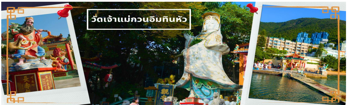
CHXH9 ฮ่องกง-มาเก๊าเดย์ทัวร์ เที่ยวจุใจ 4วัน2คืน สายการบิน Hongkong Airlines (Jun-Oct' 26)

เช้า ❗️ บริการอาหารเช้า ณ ภัตตาคาร **เมนูติ่มซำต้นตำหรับฮ่องกง** (3) จากนั้นนำท่านเดินทางสู่ วัดเจ้าแม่กวนอิมหินหัว อ่าวรีพลัสเบย์ (TIN HAU TEMPLE REPULSE BAY) ตั้งอยู่ริมทะเล เป็นสถานที่ท่องเที่ยวสำคัญ สร้างขึ้นในปี ค.ศ.1993 วัดแห่งนี้ถูกสร้างขึ้นเพื่อคุ้มครองชาวประมงในการออกเรือไปหาปลา ซึ่งเป็นหนึ่งในวัดที่เก่าแก่ที่สุดของฮ่องกง บริเวณวัดจะมี เจ้าแม่กวนอิมองค์ใหญ่ ประดิษฐานพระพุทธรูปตั้งอยู่เป็นเทพที่ชาวฮ่องกงและคนจีนให้ความเคารพนับถือมากที่สุด สามารถขอพรได้ทุกเรื่อง วัดนี้เป็นที่นิยมมีนักท่องเที่ยวเดินทางมาขอพรกันมากมาย เพราะเชื่อในความศักดิ์สิทธิ์ และยังมีเจ้าแม่ทับทิม หรือเทพิตาแห่งท้องทะเลองค์ใหญ่ ซึ่งคนฮ่องกง คนมาเก๊า และคนจีน ที่อยู่ริมทะเล ชาวประมง นักเดินเรือหรือผู้ที่เดินทางทางเรือเป็นประจำ จะนับถือ