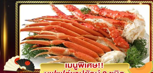
เมนูพิเศษ!! บุฟเฟ่ต์งาช้าง 3 ชนิด