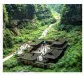
หลุมฟ้าสะพานสวรรค์