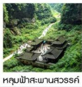
หลุมฟ้าสะพานสวรรค์