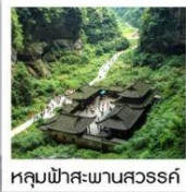
หลุมฟ้าสะพานสวรรค์