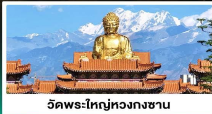
วัดพระใหญ่ทองกงซาน