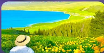
ทะเลสาบไซท์ลี่มู่