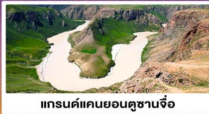
แกรนด์แคนยอนตูซานจื่อ