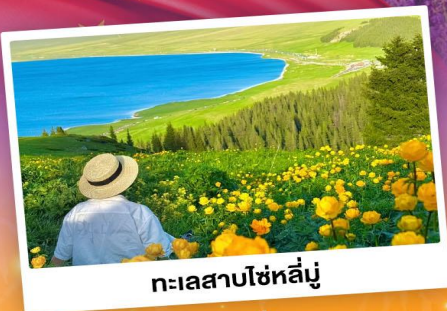
ทะเลสาบโซห์ลีมู่

ถ่ายรูปทุ่งดอกลาเวนเดอร์ - ทุ่งหญ้าคาลาจั้น SKY GRASSLAND ทุ่งหญ้ามรดกโลก