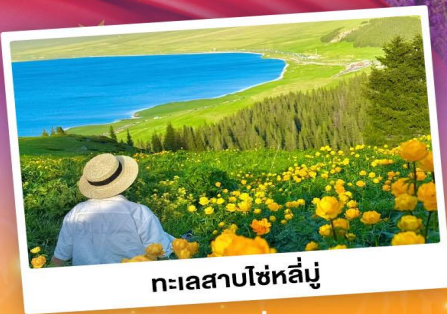
ทะเลสาบโซห์ลีมู่

ถ่ายรูปทุ่งดอกลาเวนเดอร์ - ทุ่งหญ้าคาลาจั้น SKY GRASSLAND ทุ่งหญ้ามรดกโลก