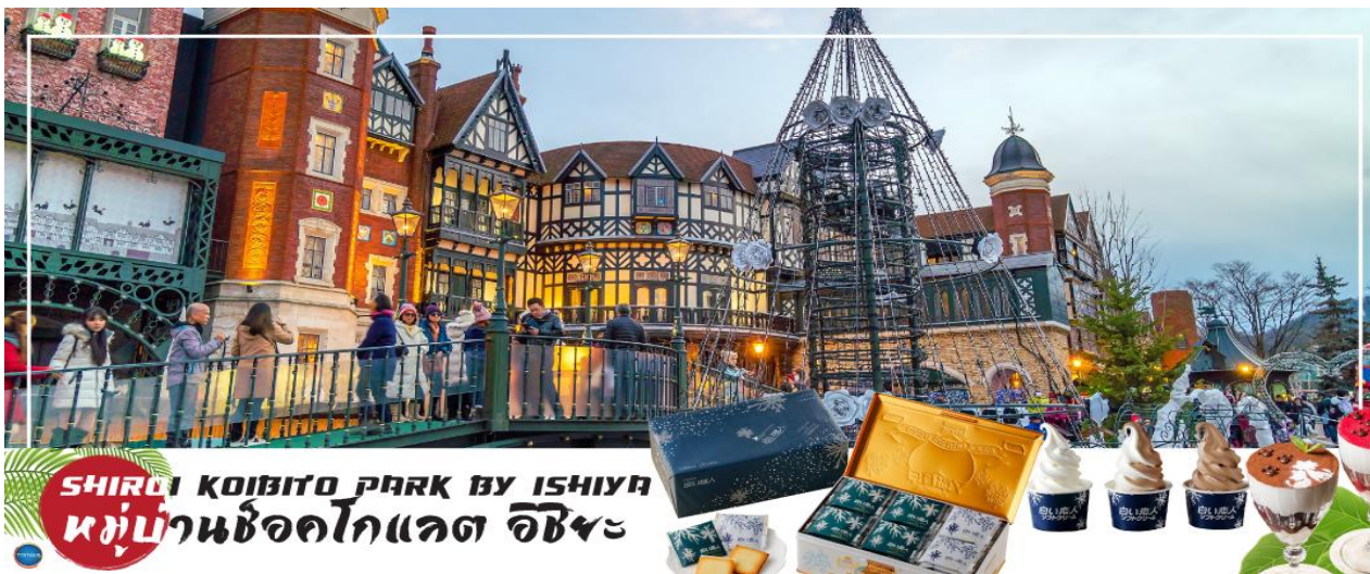
SHIROI KOIBITO PARK BY ISHIYAMA หมู่บ้านช็อคโกแลต อิชิยามะ

โกแลตที่ขึ้นชื่อที่สุดของที่นี่คือ Shiroi Koibito ซึ่งมีความหมายว่าช็อคโกแลตชาวแต่คนรัก ท่านสามารถเลือกช็อคโกกลับไปให้คนที่ท่านรักทานหรือว่าซื้อเป็นของฝากติดไม้ติดมือกลับบ้านก็ได้ นอกจากนี้ท่านจะได้เลือกซื้อช็อคโกแลตที่หาซื้อที่ไหนไม่ได้ และ ท่านก็ยังจะได้ชมประวัติศาสตร์ความเป็นมาของโรงงาน และการผลิตช็อคโกแลตอีกด้วย