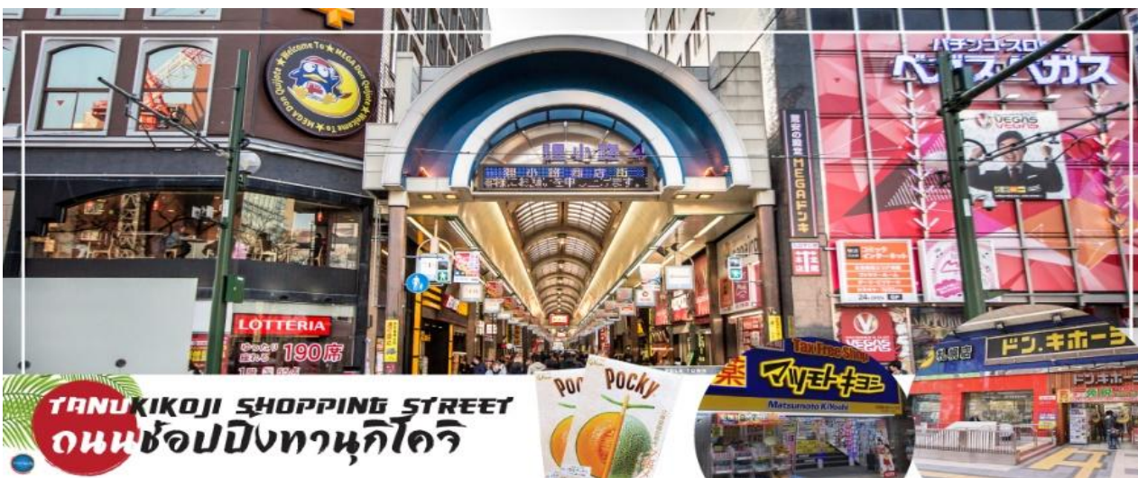
TANUKIKOJI SHOPPING STREET ถนนช้อปปิ้งทานุกิโจจิ