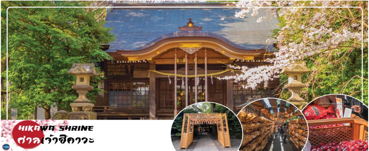
HIKAWA SHRINE ศาลเจ้าฮิกาวะ

จากนั้นนำท่านขอพรความรัก ณ ศาลเจ้าฮิกาวะ (Hikawa Shrine) (จุดชมซากุระขึ้นกับภูมิภาค) เป็นศาลเจ้าที่เชื่อว่าเด็ดยักษ์ เรื่องขอพรความรัก ภายในมี "อุโมงค์เอมะ" เอมะ คือ แผ่นไม้ที่เราเขียนขอพร และนำมาผูกจนกลายเป็นซุ้มคล้ายอุโมงค์ เป็นจุดที่นักท่องเที่ยวนิยมถ่ายรูปทำคอนเทนต์จำนวนมาก นอกจากนี้ สายไม้ไม่ควรพลาด ท่านยังสามารถซื้อเครื่องรางต่างๆ ที่ไม่ใช่เฉพาะด้านความรัก ยังมี ด้านสุขภาพ ด้านการเงิน การงาน การเรียน เดินทางปลอดภัย และโชคลาก ก็มีมากมายให้ท่านได้เลือกไว้เป็นของฝากของที่ระลึกอีกด้วย