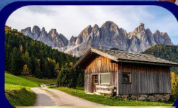
อุทยานฯ โดโลไมท์