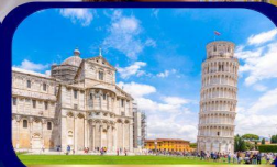
หอเอนแห่งเมืองปิซ่า

พีซิตาแลนด์มาร์คระดับโลก ครบจบในทริปเดียวที่อิตาลี กรุงโรม นครรัฐวาติกัน เมืองปิซ่า เกาะเวนิส อุทยานฯโดโลไมท์ เมืองมิลาน ขึ้นกระเช้าชมยอดเขา Seceda - จุดชมวิวโบสถ์ St.Magdalena เที่ยวชมทะเลสาบคาร์เซชา ทะเลสาบเบรียส และทะเลสาบมิซูรีน่า ช้อปปิ้ง Fidenza Village Outlet และสถานที่อื่นๆอีกมากมาย