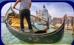
เที่ยวเกาะเวนิส