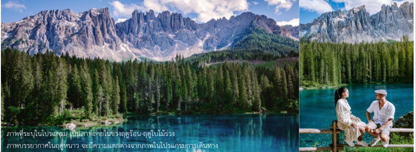
ภาพที่ระบุในโปรแกรม เป็นภาพถ่ายในช่วงฤดูร้อน-ฤดูใบไม้ร่วง ภาพบรรยากาศในฤดูหนาว จะมีความแตกต่างจากภาพในโปรแกรมการเดินทาง

มองเห็นได้อย่างชัดเจนจากทุกมุมมอง ท่านจะได้ชมความงามของภูเขา Dolomites ซึ่งได้รับการขึ้นทะเบียนเป็นมรดกโลกจากยูเนสโก ถึงเวลาอันสมควรนำท่านเดินทางกลับลงมาที่ตัวเมืองออดิเซ่