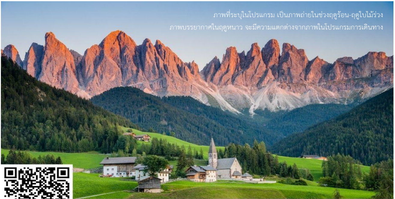
ภาพที่ระบุในโปรแกรม เป็นภาพถ่ายในช่วงฤดูร้อน-ฤดูใบไม้ร่วง ภาพบรรยากาศในฤดูหนาว จะมีความแตกต่างจากภาพในโปรแกรมการเดินทาง