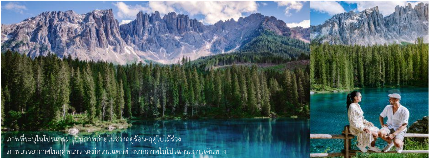
ภาพที่ระบุในโปรแกรม เป็นภาพถ่ายในช่วงฤดูร้อน-ฤดูใบไม้ร่วง ภาพบรรยากาศในฤดูหนาว จะมีความแตกต่างจากภาพในโปรแกรมการเดินทาง

มองเห็นได้อย่างชัดเจนจากทุกมุมมอง ท่านจะได้ชมความงามของภูเขา Dolomites ซึ่งได้รับการขึ้นทะเบียนเป็นมรดกโลกจากยูเนสโก ถึงเวลาอันสมควรนำท่านเดินทางกลับลงมาที่ตัวเมืองออดิเซ่