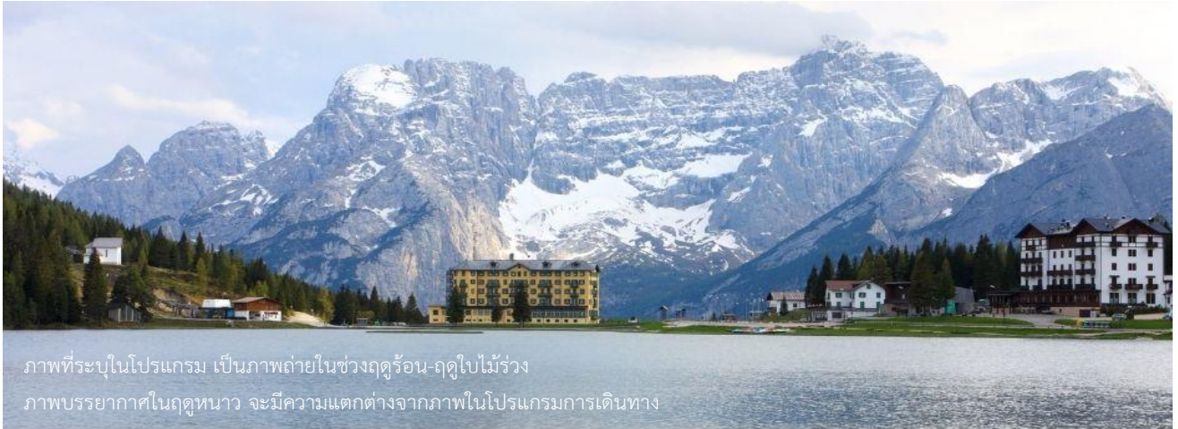
ภาพที่ระบุในโปรแกรม เป็นภาพถ่ายในช่วงฤดูร้อน-ฤดูใบไม้ร่วง ภาพบรรยากาศในฤดูหนาว จะมีความแตกต่างจากภาพในโปรแกรมการเดินทาง