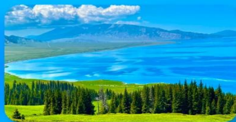
ทะเลสาบไช่หลี่มู่