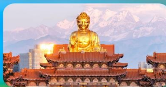
วัดพระใหญ่หวงกงชาน