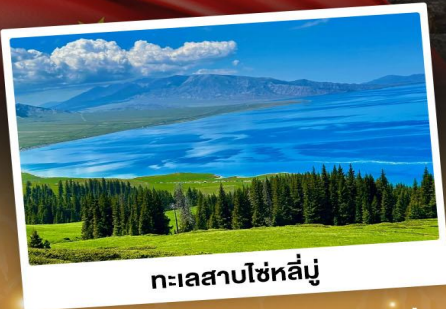
ทะเลสาบไซทูลูมู่

ชมวิวดอกดอกลังการแบบยุโรปผสมเอเชีย กุ้งหล्यानียิวฉ่า ทะเลสาบสีเทอร์ควอยซ์