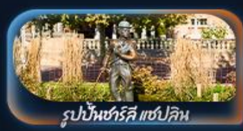
รูปปั้นชาร์ลี แชปลิน

14-22 ต.ค. 69 / 21-29 ต.ค. 69 28 ต.ค. - 05 พ.ย. 69 / 04-12 พ.ย. 69 / 10-18 พ.ย. 69