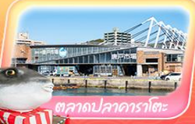
ศาลาปลาคาราโอเกะ

vietjetair.com สายการบิน Vietjet Air (VZ) น้ำหนักกระเป๋า 20 KG