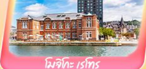
โมจิโคะ เรโทร