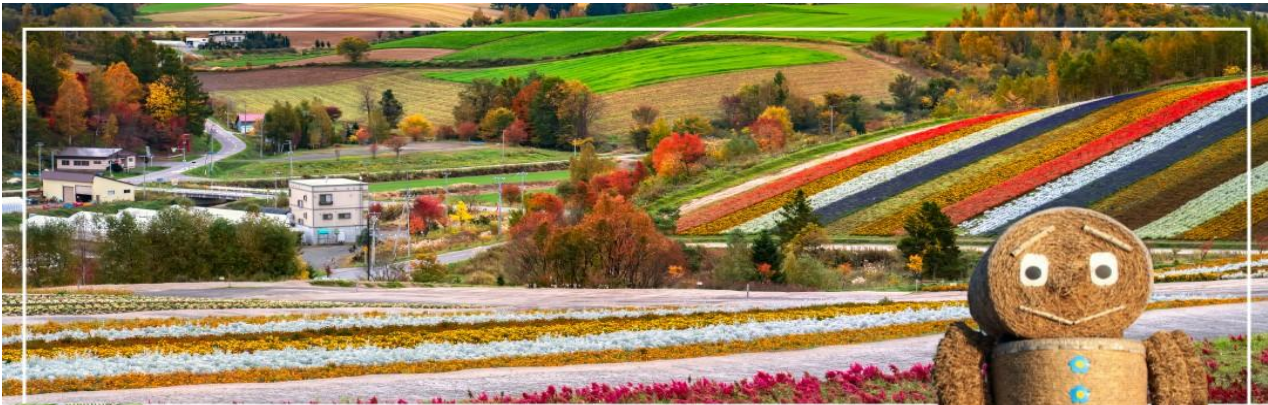
SHIKISAI NO OKA สวนชิคิไซโนะโอกะ

พันธุ์ให้ผลิดอกออกใบและสีเส้นที่สวยงาม ดั่งจะเห็นได้จากทุ่งดอกไม้ 7 สี หรือ ทุ่งอิโรโดริ (Irodori Field) ที่มีทั้งสีม่วง สีขาว สีแดง สีส้ม สีชมพู ฯลฯ งดงามตั้งสายรุ้งเลยทีเดียว จากนั้นเดินทางสู่ สวนชิคิไซโนะโอกะ (Shikisai no oka) สวนดอกไม้สดสวยแห่งเมืองนิโอะ ที่สวนแห่งนี้มีชื่อเรียกอีกอย่างว่า เนินสีฤดู เนื่องจากมีดอกไม้หลากหลายสายพันธุ์จัดเรียงสลับสีกันอย่างสวยงาม และดูได้ตลอดทุกฤดูกาลนั่นเอง สวนดอกไม้ ขนาดใหญ่มีพื้นที่ 7 เฮคเตอร์ ในช่วงฤดูร้อนเต็มไปด้วยดอกไม้ที่บานสะพรั่ง อิสรให้ท่านชมและเก็บภาพความสวยงามของดอกไม้มานานาพรรณตามอัธยาศัย ณ สวนแห่งนี้ท่านสามารถเลือกเฟลิดเฟลนไปกับกิจกรรมต่างๆ เช่น การนั่งรถ Norokko (รถลากที่ถูกลากโดยรถแทรกเตอร์) นั่งรถกอล์ฟสำหรับ 4 ท่าน หรือจะเลือกเล่นรถ ATV ก็ได้ (ราคาเครื่องเล่นไม่รวมอยู่ในราคาทัวร์ มีค่าใช้จ่ายเพิ่มเติมประมาณ 500-2000 เยน http://www.shikisainooka.jp/en/ )