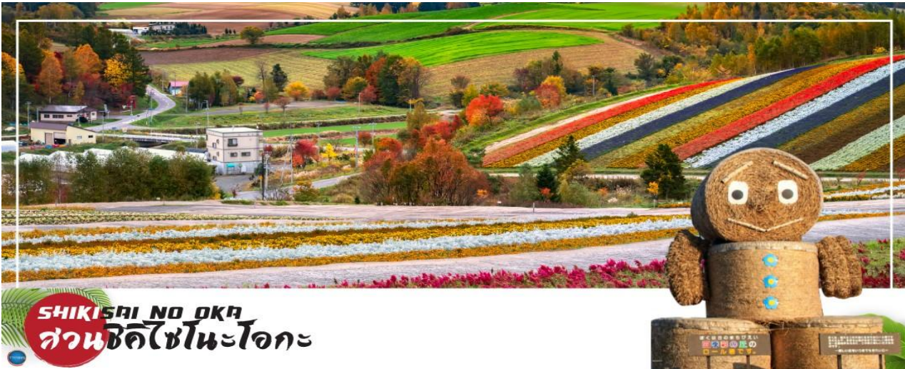
SHIKISAI NO OKA สวนชิคิไซโนะโอกะ

พันธุ์ให้ผลิดอกออกใบและสีเส้นที่สวยงาม ดั่งจะเห็นได้จากทุ่งดอกไม้ 7 สี หรือ ทุ่งอิโรโดริ (Irodori Field) ที่มีทั้งสีม่วง สีขาว สีแดง สีส้ม สีชมพู ฯลฯ งดงามตั้งสายรุ้งเลยทีเดียว จากนั้นเดินทางสู่ สวนชิคิไซโนะโอกะ (Shikisai no oka) สวนดอกไม้ที่สวยงามแห่งเมืองนิโอะ ที่สวนแห่งนี้มีชื่อเรียกอีกอย่างว่า เนินสีฤดู เนื่องจากมีดอกไม้หลากหลายสายพันธุ์จัดเรียงสลับสีกันอย่างสวยงาม และดูได้ตลอดทุกฤดูกาลนั่นเอง สวนดอกไม้ ขนาดใหญ่มีพื้นที่ 7 เฮกเตอร์ ในช่วงฤดูร้อนเต็มไปด้วยดอกไม้ที่บานสะพรั่ง อีสระให้ท่านชมและเก็บภาพความสวยงามของดอกไม้บานาพรรณตามอัธยาศัย ณ สวนแห่งนี้ท่านสามารถเลือกเฟลิดเฟลนไปกับกิจกรรมต่างๆ เช่น การนั่งรถ Norokko (รถลากที่ถูกลากโดยรถแทรกเตอร์) นั่งรถกอล์ฟสำหรับ 4 ท่าน หรือจะเลือกเล่นรถ ATV ก็ได้ (ราคาเครื่องเล่นไม่รวมอยู่ในราคาทัวร์ มีค่าใช้จ่ายเพิ่มเติมประมาณ 500-2000 เยน http://www.shikisainooka.jp/en/ )