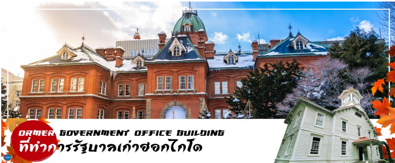
FORMER GOVERNMENT OFFICE BUILDING ที่ทำการรัฐบาลเก่าซอกไกโด

นำท่านเดินทางสู่ ย่านซุซุกิโนะ(Susukino) นับเป็นย่านที่เต็มไปด้วยแหล่งบันเทิงที่โด่งดังมากที่สุดของเมืองซัปโปโร(Sapporo) อีกทั้งยังเรียกได้ว่าเป็นย่านบันเทิงที่ใหญ่ที่สุดในทางตอนเหนือของญี่ปุ่นทีเดียวละคะ บอกเลยว่าอยากมาบันเทิงใจยามค่ำคืนสัมผัสไลฟ์สไตล์แบบคนญี่ปุ่นแท้ๆ ต้องมาที่นี่ให้ได้เลยละคะ เพราะเต็มไปด้วยร้านค้า บาร์ ร้านอาหาร ร้านคาราโอเกะ และตุ๋ปาลังโกะ รวมกว่า 4,000 ร้าน บางร้านนี้เปิดจนถึงเที่ยงเที่ยงคืน