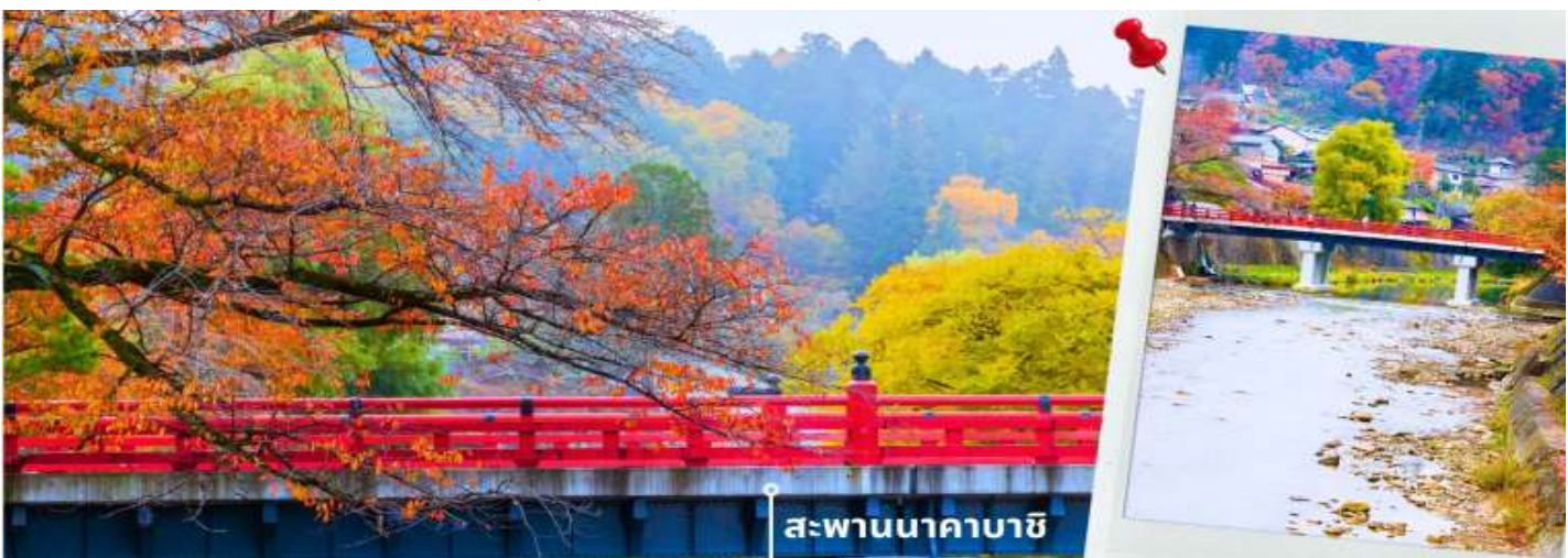
** ระยะเวลาการเปลี่ยนสีขอใบไม้จะขึ้นอยู่กับสายพันธุ์และสภาพอากาศ **

08.25 น. เดินทางถึงสนามบินนานาชาติซูบุเซ็นแทรร์ ประเทศญี่ปุ่น หลังจากผ่านพิธีตรวจคนเข้าเมืองและศุลกากรแล้ว นำท่านขึ้นรถโค้ชปรับอากาศ เดินทางรับประทานอาหารเที่ยง รับประทานอาหารเที่ยง ณ ภัตตาคาร (2) เมนูพิเศษ เชืตหมุย่างไบโฮบะ จากนั้นนำท่านเดินทางสู่ เมืองทาคายามา ซึ่งเป็นเมืองเล็กๆ ที่ตั้งอยู่ในจังหวัดกิฟุ ที่ห้อมล้อมไปด้วยภูเขาและธารน้ำใส พาท่านแวะถ่ายรูปและชมวิวที่ สะพานนาคาบาชิ เป็นสะพานที่สามารถเห็นได้ชัดอย่างโดดเด่นจากสีที่แดงเข้ม อีกทั้ง สะพานแห่งนี้ยังถือเป็นสัญลักษณ์ที่สำคัญจุดหนึ่งของเมือง โดยเฉพาะใบไม้เปลี่ยนสีที่จะมีใบไม้สีสันสดใสสะพรั่งอยู่ราย ล้อมตัวสะพาน จนกลายเป็นจุดชมวิวยอดนิยมแห่งหนึ่งของเมืองทาคายามา