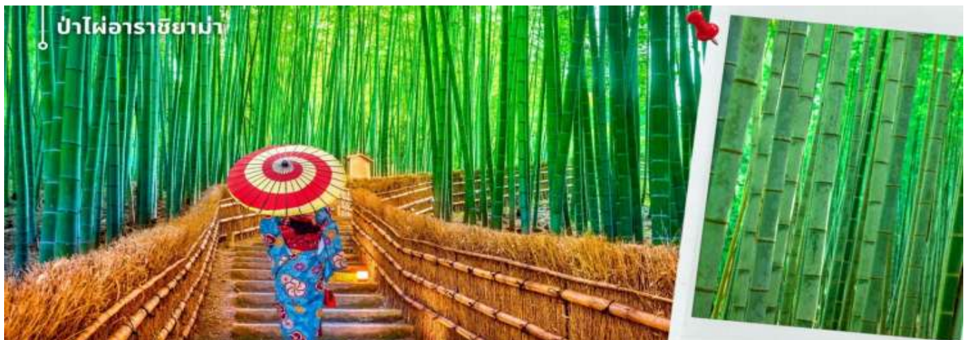
ป่าไผ่อาราชิยาม่า

จากนั้นนำท่านเดินทางสู่ ป่าไผ่อาราชิยาม่า ซึ่งอยู่ไม่ไกลจากสะพานโทเก็ตสึเคียว ป่าไผ่แห่งนี้เป็นป่าไผ่ที่ใหญ่ที่สุดในญี่ปุ่น ทั้งสวยและโด่งดังที่สุดในประเทศญี่ปุ่น โดยตลอดสองข้างทางนั้นจะมีต้นไผ่สีเขียวขจีสูงเสียดฟ้า ยาวกว่า 10 เมตร เรียงรายอยู่เป็นระยะทางประมาณ 500 เมตร ที่จะทำให้เราได้ดื่มด่ำไปกับเสียงต้นไผ่ที่กระทบกัน ให้ความร่มรื่นสงบ เย็นสบาย และแสงที่ลอดผ่านต้นไม้ไผ่ให้ความรู้สึกอบอุ่น เป็นเสน่ห์อีกอย่างหนึ่ง ให้ท่านได้เดินชมและเก็บภาพความประทับใจเป็นที่ระลึก