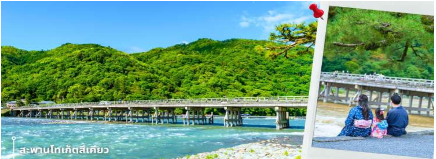
สะพานโทเก็ตสึเคียว

จากนั้นนำท่านเดินทางสู่ ป่าไผ่อาราชิยาม่า ซึ่งอยู่ไม่ไกลจากสะพานโทเก็ตสึเคียว ป่าไผ่แห่งนี้เป็นป่าไผ่ที่ใหญ่ที่สุดในญี่ปุ่น ทั้งสวยและโด่งดังที่สุดในประเทศญี่ปุ่น โดยตลอดสองข้างทางนั้นจะมีต้นไผ่สีเขียวขจีสูงเสียดฟ้า ยาวกว่า 10 เมตร เรียงรายอยู่เป็นระยะทางประมาณ 500 เมตร ที่จะทำให้เราได้ดื่มด่ำไปกับเสียงต้นไผ่ที่กระทบกัน ให้ความร่มรื่นสงบ เย็นสบาย และแสงที่ลอดผ่านต้นไม้ไผ่ให้ความรู้สึกอบอุ่น เป็นเสน่ห์อีกอย่างหนึ่ง ให้ท่านได้เดินชมและเก็บภาพความประทับใจเป็นที่ระลึก