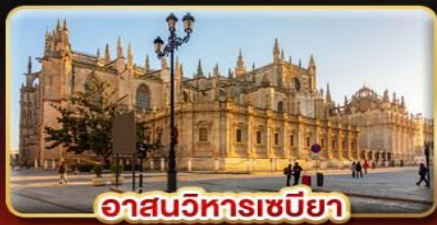
อาสนวิหารเซบิยา