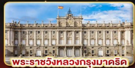
พระราชวังหลวงกรุงมาดริด