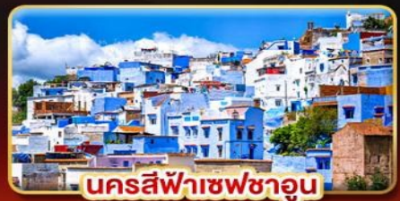
นครสีฟ้าเชฟชาอูน

ท่องเที่ยวข้ามทวีป โมร็อกโก-สเปน เที่ยวเมืองสีฟ้าสุดชิค สัมผัสเสน่ห์ยุโรปได้ ครบทั้งประวัติศาสตร์และจุดถ่ายรูปสวยระดับโลก