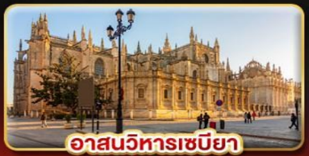
อาสนวิหารเซบิยา