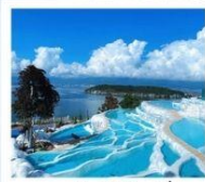
ซานโตรินี่ต้าหลี่