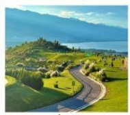
กุช่าววันเซียงซาน