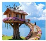
หมู่บ้านเหวินปี้