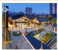
ถนนคนเดินไท่กู่หลี่