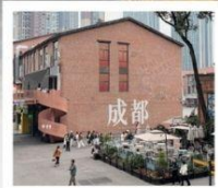
EASTERN SUBURB MEMORY