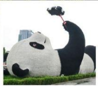
รูปปั้นแพนด้าเซลฟี