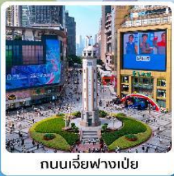
ถนนเจียงฟางเป่ย์