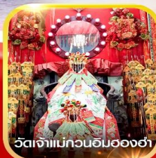
วัดเจ้าแม่กวนอิมอองฮ่า

คอนเฟิร์ม ออกเดินทาง ทุกพีเรียด 2 ท่านขึ้นไป