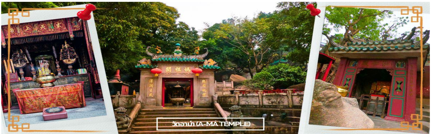
วัดอาม่า (A-MA TEMPLE)

จากบริเวณวัดอาม่าแห่งนี้เอง โดยในอดีตจะมีอ่าวที่ชื่อว่า อาม่าก๊อก แปลว่า อ่าวของอาม่า จึงเพี้ยนมาเป็นชื่อ มาเก๊า ในปัจจุบันนั่นเอง ต่อมาในปี 2005 วัดอาม่า มาเก๊า ได้รับการขึ้นทะเบียนให้เป็นมรดกโลกโดย UNESCO ซึ่งตัววัดเองมีตำนานเล่าว่า มีเด็กสาวชื่อว่า หลินโม ซึ่งเป็นเด็กที่เฉลียวฉลาด สามารถหยั่งรู้ถึงความเจ็บไข้ได้ป่วยของผู้อื่น อยู่มาวันหนึ่ง หลินโม มีความคิดอยากจะทำมาค้าขายที่คาบสมุทรอ่าวเหมิน จึงขอดิดเรือไปกับคนอื่นที่อยากจะข้ามฝั่งด้วยเช่นกัน แต่มีเหตุการณ์ไม่คาดคิด เกิดพายุโหมกระหน่ำ ทำให้เรือหลายลำที่เดินทางไปด้วย กันจมลงสู่ใต้ท้องทะเล ยกเว้นเรือที่มีหลินโม จนทำให้สามารถที่สามารถเดินทางถึงฝั่งได้โดยสวัสดิภาพ และต่อมาเธอก็ได้มาเสียชีวิตลงบริเวณอ่าว A Ma วิญญาณของเธอก็มักจะคอยช่วยเหลือชาวประมงให้พ้นภัยอันตรายและปลอดภัย ผู้คนจึงเชื่อว่านางเป็นเทพธิดาแห่งท้องทะเล จึงได้สร้างวัดนี้ขึ้นเพื่ออุทิศให้แก่นางหลินโมจากนั้นนำท่านแวะ ร้านขนม มาเก๊า ร้านค้าใหญ่ที่รวมสิ่งของพื้นเมืองที่มีเอกลักษณ์ของมาเก๊า เช่น ขนมผั้วจำ เมียจำ ลูกอมรสนม นอกจากนี้ ยังเป็นแหล่งรวมสินค้านำเข้าจากอเมริกาออสเตรเลียที่ราคาถูก เนื่องจากมาเก๊าเป็นเมืองปลอดภาษี