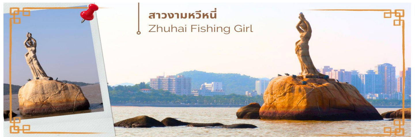
สาวงามหวีหนี่ Zhuhai Fishing Girl

จากนั้นนำท่านแวะซื้อ ยาแก่น้ำร้อนลวก ร้านยา เป่าฟู่หลิง บัวหิมะ ยาประจำบ้านที่มีชื่อเสียง ท่านจะได้ชมการสาธิตการนวดเท้า ซึ่งเป็นอีกวิธีหนึ่งในการผ่อนคลายความเครียด และบำรุงการไหลเวียนของโลหิตด้วยวิถีธรรมชาติ และนำท่าน