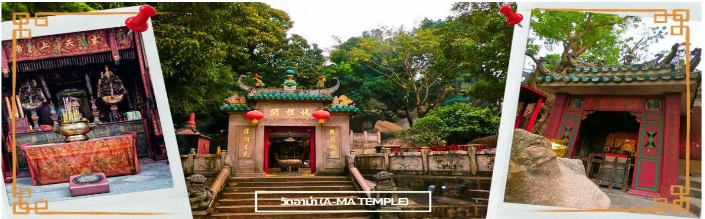
วัดอาม่า (A-MA TEMPLE)

จากบริเวณวัดอาม่าแห่งนี้เอง โดยในอดีตจะมีอ่าวที่ชื่อว่า อาม่าก๊อก แปลว่า อ่าวของอาม่า จึงเพี้ยนมาเป็นชื่อ มาเก๊า ในปัจจุบันนั่นเอง ต่อมาในปี 2005 วัดอาม่า มาเก๊า ได้รับการขึ้นทะเบียนให้เป็นมรดกโลกโดย UNESCO ซึ่งตัววัดเองมีตำนานเล่าว่า มีเด็กสาวชื่อว่า หลินโม ซึ่งเป็นเด็กที่เฉลียวฉลาด สามารถหยั่งรู้ถึงความเจ็บไข้ได้ป่วยของผู้อื่น อยู่มาวันหนึ่ง หลินโม มีความคิดอยากจะทำมาค้าขายที่คาบสมุทรอ่าวเหมิน จึงขอลิขิตเรือไปกับคนอื่นที่อยากจะข้ามฝั่งด้วยเช่นกัน แต่มีเหตุการณ์ไม่คาดคิด เกิดพายุโหมกระหน่ำ ทำให้เรือหลายลำที่เดินทางไปด้วย กันจมลงสู่ใต้ท้องทะเล ยกเว้นเรือที่มีหลินโม จนทำให้สามารถที่สามารถเดินทางถึงฝั่งได้โดยสวัสดิภาพ และต่อมาเธอก็ได้มาเสียชีวิตลงบริเวณอ่าว A Ma วิญญาณของเธอ ก็มักจะคอยช่วยเหลือชาวประมงให้พ้นภัยอันตรายและปลอดภัย ผู้คนจึงเชื่อว่านางเป็นเทพธิดาแห่งท้องทะเล จึงได้สร้างวัดนี้ขึ้นเพื่ออุทิศให้แก่นางหลินโมจากนั้นนำท่านแฉะ ร้านขนม มาเก๊า ร้านค้าใหญ่ที่รวมสิ่งของพื้นเมืองที่มีเอกลักษณ์ของมาเก๊า เช่น ขนมผั้วจำ เมียจำ ลูกอมรสนม นอกจากนี้ ยังเป็นแหล่งรวมสินค้านำเข้าจากออสเตรเลียที่ราคาถูก เนื่องจากมาเก๊าเป็นเมืองปลอดภาษี