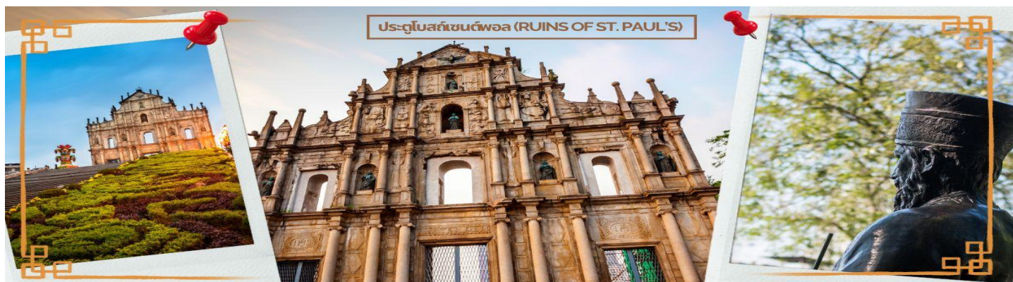
ประตูโบสถ์เซนต์พอล (RUINS OF ST. PAUL'S)

ได้เวลาอันสมควร นำท่านเดินทางสู่ เมืองจูไห่ (ZHUHAI) เป็นเมืองที่มีอาณาบริเวณเขตมหาสมุทรใหญ่ ที่สุด มีเกาะมากที่สุด และมีแนวชายฝั่งทางทะเลยาวที่สุดใน ภูมิภาคสามเหลี่ยมปากแม่น้ำ จูเจียง ซึ่งตั้งอยู่ทางริมฝั่งตะวันตก ของปากแม่น้ำจูเจียง หรือแม่น้ำไข่มุกที่ไหลลงสู่ทะเลจีนใต้ใน มณฑลกวางตุ้ง ทางตอนใต้ของประเทศจีน