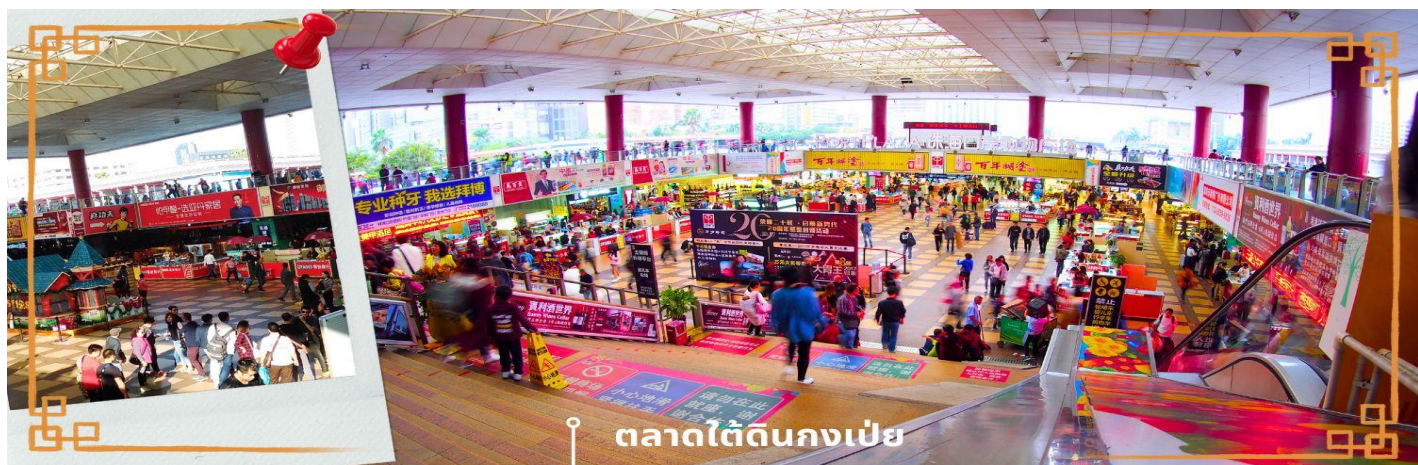
ตลาดใต้ดินกงเป๋ย

เย็น ๑๐ บริการอาหารเย็น ณ ภัตตาคาร (4) โรงแรมที่พัก นำท่านเข้าสู่ที่พัก IRVINE HOLIDAY HOTEL หรือเทียบเท่า