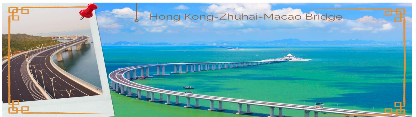
CHXH10 ฮองกง-มาเก๊า-จูไห่ 4 วัน 2 คืน บิน Hong Kong Airlines (HX) May-Oct'26 หน้า 3

02.40 น. นำท่านเดินทางสู่ ฮองกง โดยสายการบิน HONG KONG AIRLINES (HX) เที่ยวบินที่ HX768 07.00 น. เดินทางถึงสนามบินเซ็กแล็บก๊อก เขตปกครองพิเศษฮองกง นำทุกท่านเข้าพิธีการตรวจคนเข้าเมืองหลังจากผ่านพิธีการตรวจคนเข้าเมืองเป็นที่เรียบร้อยแล้ว รับกระเป๋าสัมภาระ และเดินทางโดยรถโค้ชปรับอากาศ เวลาท้องถิ่นที่ฮองกงเร็วกว่าประเทศไทย 1 ชั่วโมง กรุณาปรับนาฬิกาให้ตรงกับเวลาท้องถิ่น เพื่อสะดวกในการนัดเวลา จากนั้นนำท่านเดินทางสู่ มาเก๊า (MACAU) หรือ เอ้าเหมิน (รถโค้ชปรับอากาศ) ด้วยการเดินทางผ่านเส้นทางสะพาน Hong kong – Zhuhai – Macao Bridge สะพานมีความยาว 55 กิโลเมตร ซึ่งเป็นสะพานข้ามทะเลที่ยาวที่สุดในโลก สะพานดังกล่าวเปิดใช้งาน เมื่อวันที่ 23 ต.ค. 2561 ซึ่งเชื่อมระหว่างเขตบริหารพิเศษฮองกง กับเมืองจูไห่ของมณฑลกวางตุ้ง และเขตบริหารพิเศษมาเก๊าของจีน โดยสะพานเส้นทางนี้นับเป็นครั้งแรก ที่จะช่วยลดระยะเวลาการเดินทางจากฮองกง ไปยังจูไห่และมาเก๊า จากเดิม 3 ชั่วโมง ให้เหลือเพียงภายใน 1 ชั่วโมง มาเก๊า มีชื่อทางการว่า เขตบริหารพิเศษมาเก๊าแห่งสาธารณรัฐประชาชนจีน เป็นพื้นที่บนชายฝั่งทางใต้ของประเทศจีน เป็นเขตปกครองพิเศษของจีน โดยมีฐานะเป็น เขตบริหารพิเศษภายใต้หลักการ หนึ่งประเทศสองระบบ ผู้ที่อาศัยอยู่ในมาเก๊าส่วนใหญ่พูดภาษากวางตุ้งเป็นภาษาแม่ ภาษาจีนกลาง ภาษาโปรตุเกส และภาษาอังกฤษ ชาวมาเก๊า มีความหมายโดยกว้างๆ คือผู้ที่พำนักอาศัยถาวรอยู่ในมาเก๊า ส่วนในวงแคบ หมายถึง คนพื้นเมืองในมาเก๊าที่สืบทอดมาจากชาวโปรตุเกส มักจะผสมกับชาวจีนและบรรพบุรุษชาติอื่นๆ