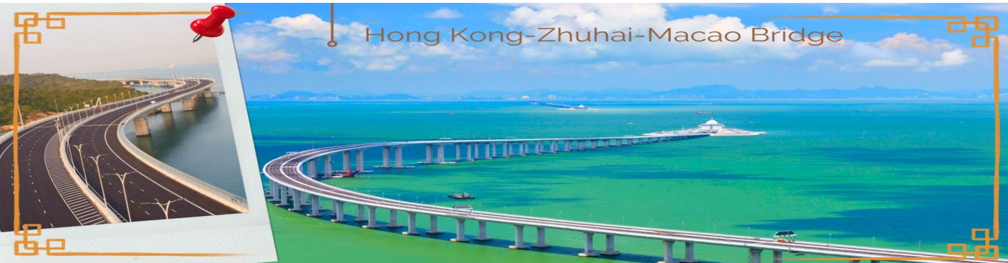
CHXH11 ฮองกง-มาเก๊า-จูไห่-สวนสนุกฉางหลง 4 วัน 2 คืน บิน Hong Kong Airlines (HX) (MAR-OCT 26)