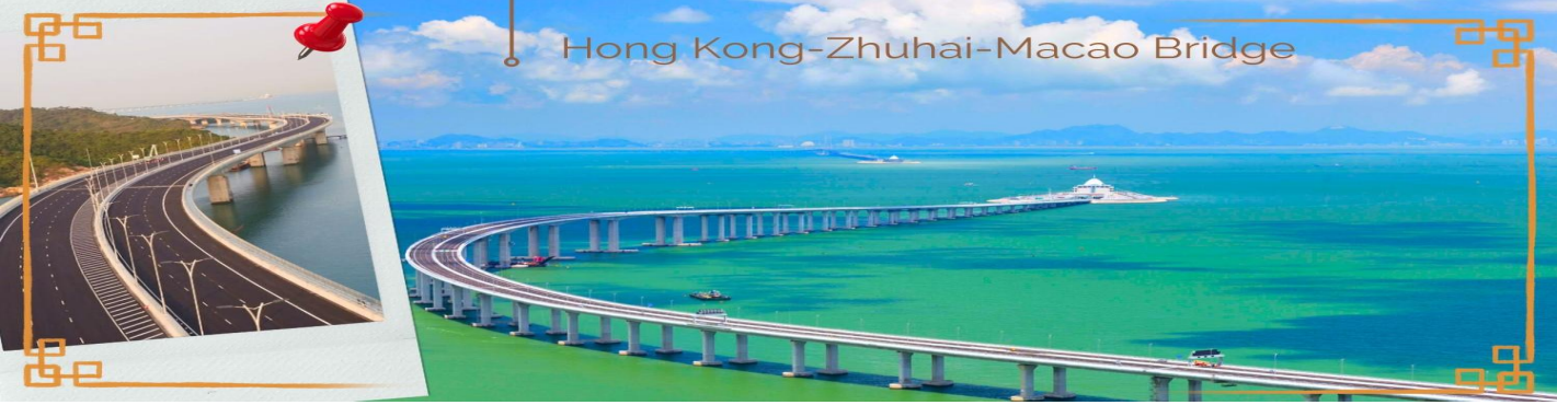
CHXH11 ฮองกง-มาเก๊า-จูไห่-สวนสนุกกลางหล่ง 4 วัน 2 คืน บิน Hong Kong Airlines (HX) (MAR-OCT 26)

เวลาท่องเที่ยวที่ฮองกงเร็วกว่าประเทศไทย 1 ชั่วโมง กรุณาปรับนาฬิกาให้ตรงกับเวลาท้องถิ่น เพื่อสะดวกในการนัดเวลา จากนั้นนำท่านเดินทางสู่ มาเก๊า (MACAU) หรือ เอ้าเหมิน (รถโค้ชปรับอากาศ) ด้วยการเดินทางผ่านเส้นทางสะพาน Hong kong – Zhuhai – Macao Bridge สะพานมีความยาว 55 กิโลเมตร ซึ่งเป็นสะพานข้ามทะเลที่ยาวที่สุดในโลก สะพานดังกล่าวเปิดใช้งาน เมื่อวันที่ 23 ต.ค. 2561 ซึ่งเชื่อมระหว่างเขตบริหารพิเศษฮองกง กับเมืองจูไห่ของมณฑลกวางตุ้ง และเขตบริหารพิเศษมาเก๊าของจีน โดยสะพานเส้นทางนี้นับเป็นครั้งแรก ที่จะช่วยลดระยะเวลาการเดินทางจากฮองกงไปยังจูไห่และมาเก๊า จากเดิม 3 ชั่วโมง ให้เหลือเพียงภายใน 1 ชั่วโมง มาเก๊า มีชื่อทางการว่า เขตบริหารพิเศษมาเก๊าแห่งสาธารณรัฐประชาชนจีน เป็นพื้นที่บนชายฝั่งทางใต้ของประเทศจีน เป็นเขตปกครองพิเศษของจีน โดยมีฐานะเป็น เขตบริหารพิเศษภายใต้หลักการ หนึ่งประเทศสองระบบ ผู้ที่อาศัยอยู่ในมาเก๊าส่วนใหญ่พูดภาษากวางตุ้ง เป็นภาษาแม่ ภาษาจีนกลาง ภาษาโปรตุเกส และภาษาอังกฤษ ชาวมาเก๊า มีความหมายโดยกว้างๆ คือผู้ที่พำนักอาศัยถาวรอยู่ในมาเก๊า ส่วนในวงแคบ หมายถึง คนพื้นเมืองในมาเก๊าที่สืบทอดมาจากชาวโปรตุเกส มักจะผสมกับชาวจีนและบรรพบุรุษชาติอื่นๆ