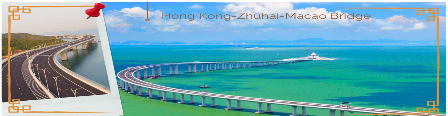
CHXH11 ฮองกง-มาเก๊า-จูไห่-สวนสนุกฉางหลง 4 วัน 2 คืน บิน Hong Kong Airlines (HX) (MAR-OCT 26)