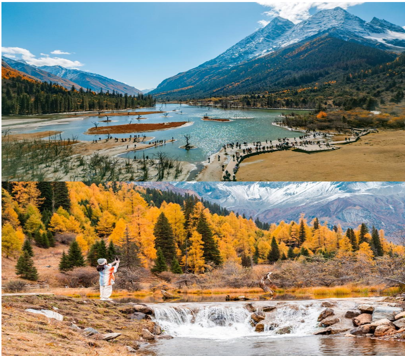
SPHZ-CD14 3 UTAYAN CHILL 6D5N ทิวทัศน์เจ็ดตึก ภูเขาสี่ดรุณี อุทยานบีไฟงโกว อุทยานธารน้ำแข็งต้ากู่ปิงชวณ