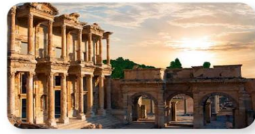
เมืองโบราณเอฟเฟซุส