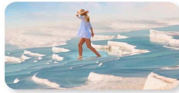
ปราสาทปูยีฝาย