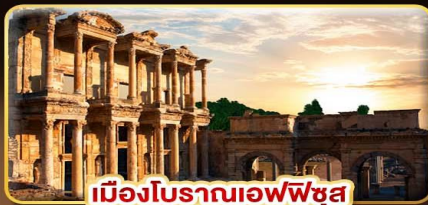
เมืองโบราณเอฟฟุซ