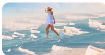
ปราสาทปูยีฝาย