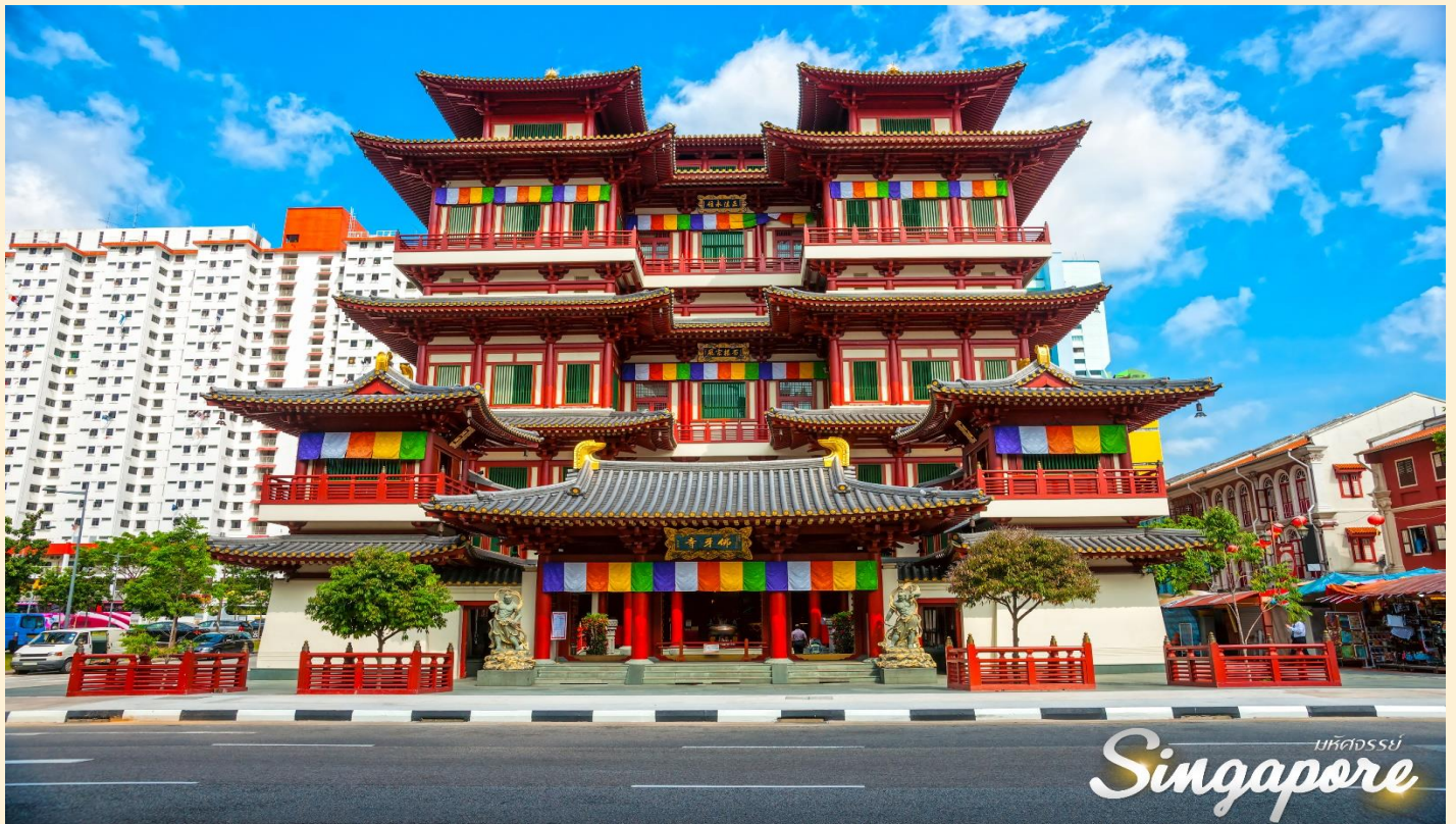
Singapore มหัทธรรษ์