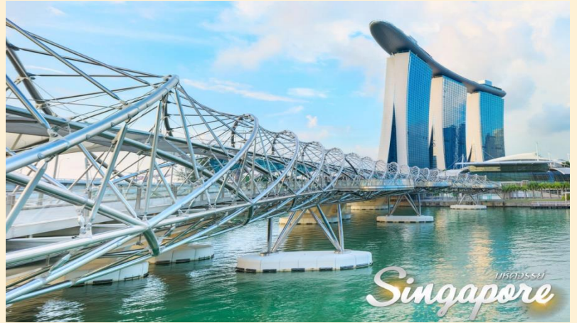
Singapore มหัทธรรษ์

ถ่ายรูปคู่สะพานรูปเกลียวคู่แห่งแรกของโลก สะพานฮิลิกซ์ สะพานรูปทรงแปลกตาที่ทอดตัวข้ามผ่านอ่าวมารีน่า ซึ่งได้รับแรงบันดาลใจมาจากโครงสร้างดีเอ็นเอของมนุษย์ ตัวสะพานถูกคุมโทนด้วยสีฟ้าของกระจกตัดกับแสงอาทิตย์ดูสดใสในตอนกลางวัน ส่วนตอนกลางคืนตัวสะพานเหล็กที่ถูกบิดเป็นเกลียวนั้นจะถูกประไฟวิบวับสวยงามที่ถูกบิดเป็นเกลียวนั้นจะถูกประไฟวิบวับสวยงาม