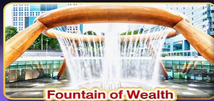
Fountain of Wealth