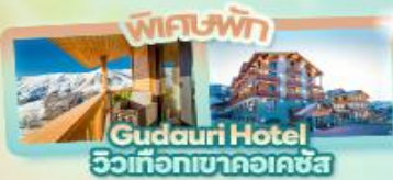
ที่พัก Gudauri Hotel วิวเทือกเขาคอเคซัส

Tbilisi Gudauri Borjomi Kazbegi Uplistsikhe