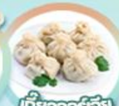
เกี้ยวจอร์เจีย Khinkali