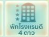
พักโรงแรมดี 4 ดาว