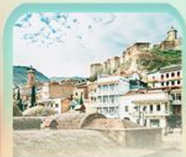
อะบาโนตูปานี