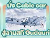
นั่ง Cable car สู่ลานสกี Gudauri