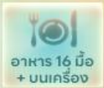
อาหาร 16 มื้อ + บนเครื่อง

เดินทาง 10-17 ก.ย.69 / 24 ก.ย.-01 ต.ค. 69