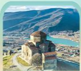
มหาวิหารจวารี