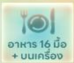
อาหาร 16 มื้อ + บนเครื่อง

เดินทาง 10-17 ก.ย.69 / 24 ก.ย.-01 ต.ค. 69