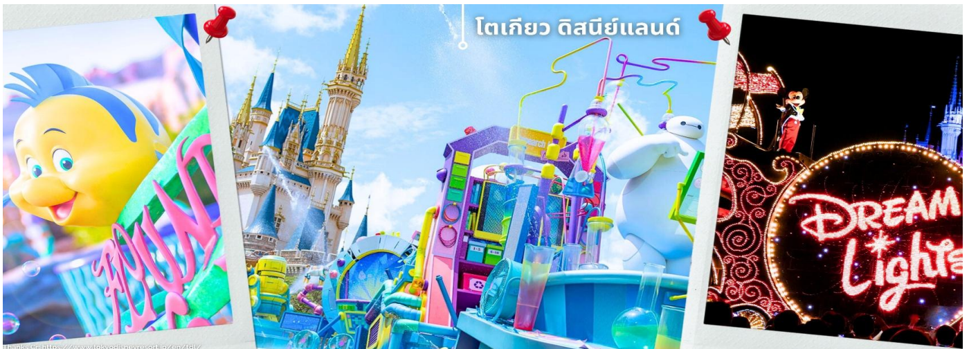
โตเกียว ดิสนีย์แลนด์

**หากต้องการซื้อบัตรเข้าสวนสนุก TOKYO DISNEYLAND หรือ TOKYO DISNEY SEA แบบ 1 DAY PASS กรุณาแจ้งล่วงหน้ากับเจ้าหน้าที่ก่อนเดินทางล่วงหน้าอย่างน้อย 14 วัน ก่อนเดินทาง**