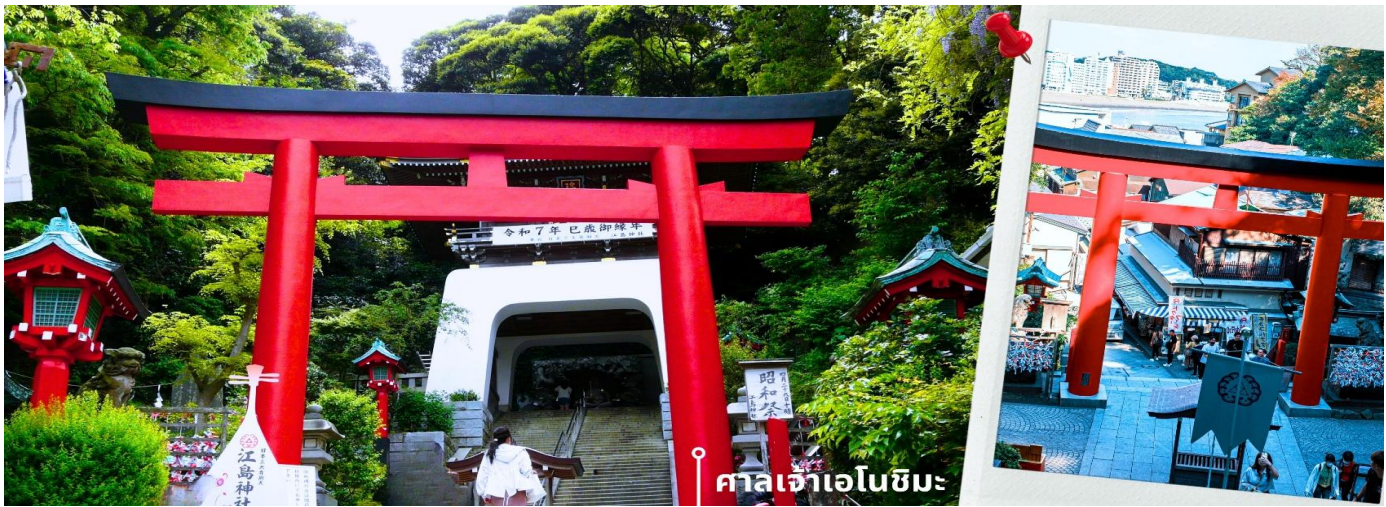
ศาลเจ้าเอโนชิมะ

จากนั้นนำท่านสักการะ ศาลเจ้าเอโนชิมะ ศาลเจ้าศักดิ์สิทธิ์ที่ตั้งอยู่บนเนินเขาของเกาะ โดดเด่นด้วยบันไดทางขึ้นที่ทอดยาวผ่านซุ้มประตูโทริอิและอาคารศาลเจ้าหลายจุดเรียงต่อกัน ภายในประดิษฐานเทพเบนไซเท็น เทพแห่งโชคลาภ ศิลปะ และความสำเร็จ บรรยากาศโดยรอบเงียบสงบ รายล้อมด้วยธรรมชาติ เหมาะสำหรับการขอพรและสัมผัสวัฒนธรรมญี่ปุ่นแบบดั้งเดิม