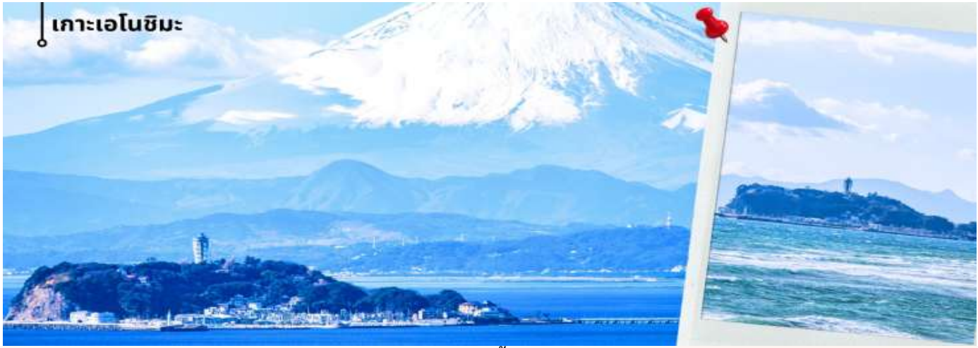
** การมองเห็นฟูภูเขาไฟฟูจิขึ้นอยู่กับสภาพอากาศ **

เช้า รับประทานอาหารเช้าที่ โรงแรม (3) หลังรับประทานอาหารเช้า นำท่านแวะชม พิพิธภัณฑสถานแผ่นดินไหว เป็นพิพิธภัณฑสถานที่มีห้องจัดแสดงข้อมูลการประทุของภูเขาไฟจากทุกมุมโลก โชนความรู้ต่างๆและโซนข้อปิ้งสินค้าญี่ปุ่นอาทิเช่น ผลิตภัณฑ์เครื่องสำอางและของฝากอีกมากมาย จากนั้นนำท่านเดินทางสู่ เกาะเอโนชิมะ ผ่านสะพานเอโนชิมะ เบนเท็น ซึ่งเป็นเส้นทางเชื่อมระหว่างแผ่นดินใหญ่กับตัวเกาะ ระหว่างทางสามารถชมบรรยากาศของท้องทะเลและวิวชายฝั่งได้อย่างเพลิดเพลิน และในวันที่อากาศแจ่มใสยังสามารถมองเห็นภูเขาไฟฟูจิได้จากระยะไกลอีกด้วย