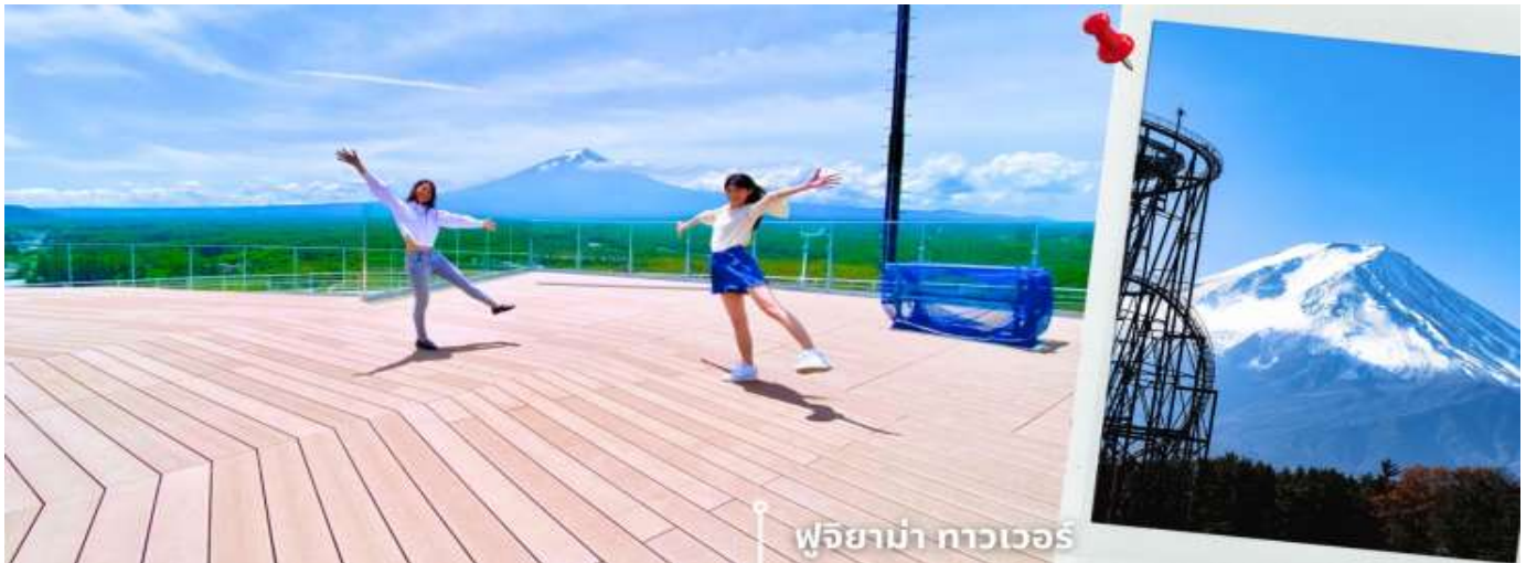
**การมองเห็นภูเขาไฟฟูจิ ขึ้นอยู่กับสภาพอากาศ**

หลังรับประทานอาหารเที่ยง นำท่านเดินทางสู่ หอคอยชมวิฟูจิยาม่า ทาวเวอร์ จังหวัดยามานาชิ เป็นหอคอยที่สร้างอยู่ภายในรถไฟเหาะ มีความสูงถึง 55 เมตร จึงทำให้เป็นจุดชมวิฟูจิที่ให้ท่านได้สัมผัสธรรมชาติและภูเขาไฟฟูจิได้อย่างใกล้ชิดในมุมมองที่แปลกใหม่ ภายในทาวเวอร์มีจุดชมวิฟูจิแบบพาโนรามา สามารถมองเห็นภูเขาไฟฟูจิและทิวทัศน์โดยรอบได้อย่างชัดเจน ทั้งยังมีโซนกิจกรรมและมุมถ่ายภาพที่ออกแบบให้ใกล้ชิดกับธรรมชาติ สร้างประสบการณ์ที่ทั้งตื่นเต้นและน่าประทับใจ ให้ท่านอิสระถ่ายภาพตามอัธยาศัย