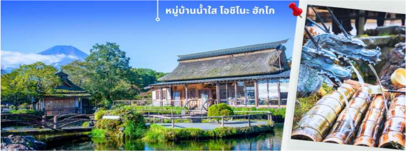
หมู่บ้านน้ำใส โอชิโนะ อักโก

จากนั้นท่านเดินทางสู่ จังหวัดชิซุโอกะ Shizuoka เป็นจังหวัดในประเทศญี่ปุ่น ตั้งอยู่ในภูมิภาคชูบุ บนเกาะฮอน มีพื้นที่ยาวตามแนวชายฝั่งมหาสมุทรแปซิฟิก จังหวัดนี้เป็นที่ตั้งของภูเขาฟูจิและมีชื่อเสียงของการปลูกชาเขียวที่ดีที่สุดญี่ปุ่น นำท่านเดินทางช้อปปิ้งที่ โกเทมบะ พรีเมียม เอ้าท์เล็ต Gotemba premium outlet อยู่ที่ฮาโกเน่ (Hakone) ได้ชื่อว่าเป็น Outlet ที่ใหญ่ที่สุดในญี่ปุ่น มีทั้งสินค้าแบรนด์ในประเทศและแบรนด์ต่างประเทศ มีร้านค้ากว่า 200 ร้าน และศูนย์อาหาร ภายในมีร้านค้าต่างๆหลากหลายแบรนด์ ไม่ว่าจะเป็นเสื้อผ้าแฟชั่น อุปกรณ์กีฬา เครื่องใช้ในครัวเรือน และสินค้าอิเล็กทรอนิกส์ แบรนด์ก็จะมีทั้ง Adidas, Alexander McQueen, Alexander Wang, Balenciaga, Birkenstock, Burberry, Bvlgari, Cath Kidston, Celine, G-Shock, Gucci, Issey Miyake, Kate Spade New York, Nike, Ralph Lauren, Ray-Ban, Saint Laurent และแบรนด์อื่นๆอีกมากให้ท่านได้อิสระช้อปปิ้งตามอัธยาศัย