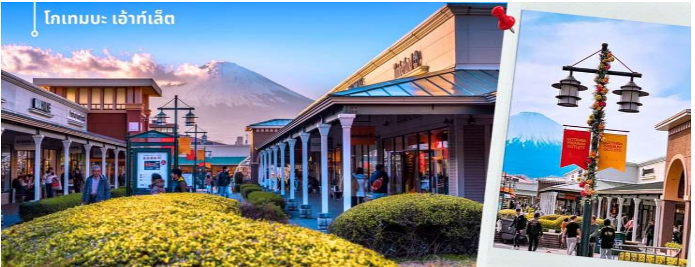
โกเทมบะ เอ้าท์เล็ต

จากนั้นท่านเดินทางสู่ จังหวัดชิซุโอกะ Shizuoka เป็นจังหวัดในประเทศญี่ปุ่น ตั้งอยู่ในภูมิภาคชูบุ บนเกาะฮอน มีพื้นที่ยาวตามแนวชายฝั่งมหาสมุทรแปซิฟิก จังหวัดนี้เป็นที่ตั้งของภูเขาฟูจิและมีชื่อเสียงของการปลูกชาเขียวที่ดีที่สุดญี่ปุ่น นำท่านเดินทางช้อปปิ้งที่ โกเทมบะ พรีเมียม เอ้าท์เล็ต Gotemba premium outlet อยู่ที่ฮาโกเน่ (Hakone) ได้ชื่อว่าเป็น Outlet ที่ใหญ่ที่สุดในญี่ปุ่น มีทั้งสินค้าแบรนด์ในประเทศและแบรนด์ต่างประเทศ มีร้านค้ากว่า 200 ร้าน และศูนย์อาหาร ภายในมีร้านค้าต่างๆหลากหลายแบรนด์ ไม่ว่าจะเป็นเสื้อผ้าแฟชั่น อุปกรณ์กีฬา เครื่องใช้ในครัวเรือน และสินค้าอิเล็กทรอนิกส์ แบรนด์ก็จะมีทั้ง Adidas, Alexander McQueen, Alexander Wang, Balenciaga, Birkenstock, Burberry, Bvlgari, Cath Kidston, Celine, G-Shock, Gucci, Issey Miyake, Kate Spade New York, Nike, Ralph Lauren, Ray-Ban, Saint Laurent และแบรนด์อื่นๆอีกมากให้ท่านได้อิสระช้อปปิ้งตามอัธยาศัย