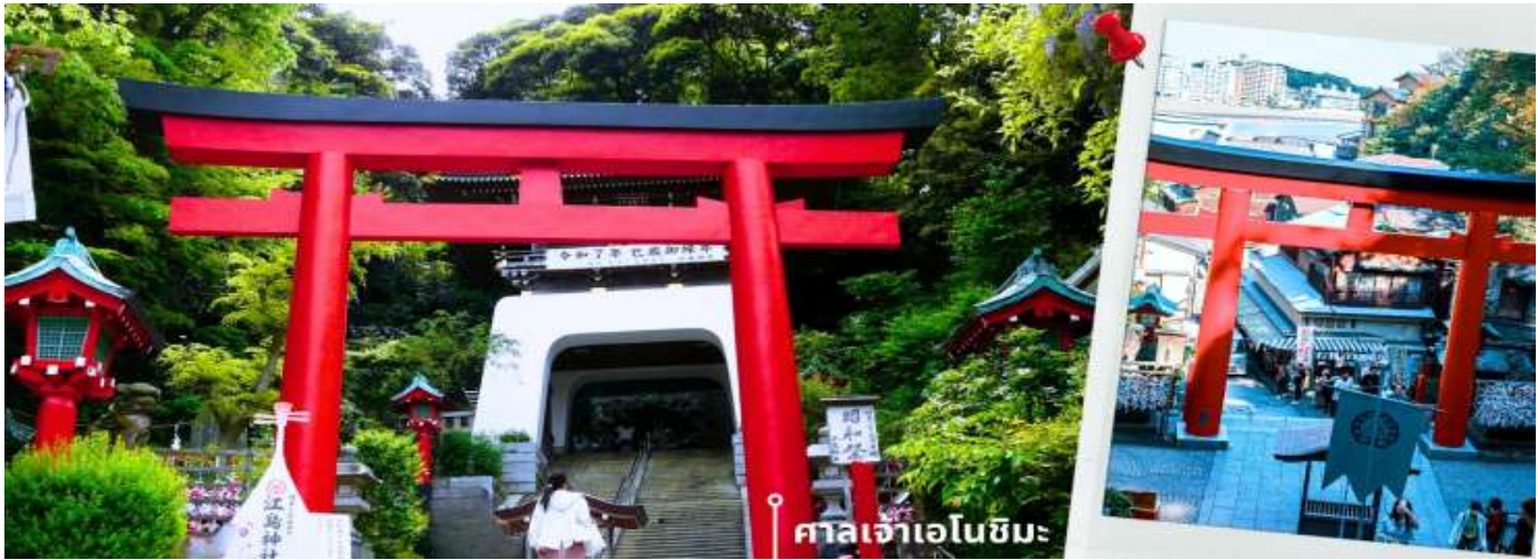
ศาลเจ้าเอโนชิมะ

จากนั้นนำท่านสักการะ ศาลเจ้าเอโนชิมะ ศาลเจ้าศักดิ์สิทธิ์ที่ตั้งอยู่บนเนินเขาของเกาะ โดดเด่นด้วยบันไดทางขึ้นที่ทอดยาวผ่านซุ้มประตูโทริอิและอาคารศาลเจ้าหลายจุดเรียงต่อกัน ภายในประดิษฐานเทพเบนไซเท็น เทพแห่งโชคลาภ ศิลปะ และความสำเร็จ บรรยากาศโดยรอบเงียบสงบ รายล้อมด้วยธรรมชาติ เหมาะสำหรับการขอพรและสัมผัสวัฒนธรรมญี่ปุ่นแบบดั้งเดิม