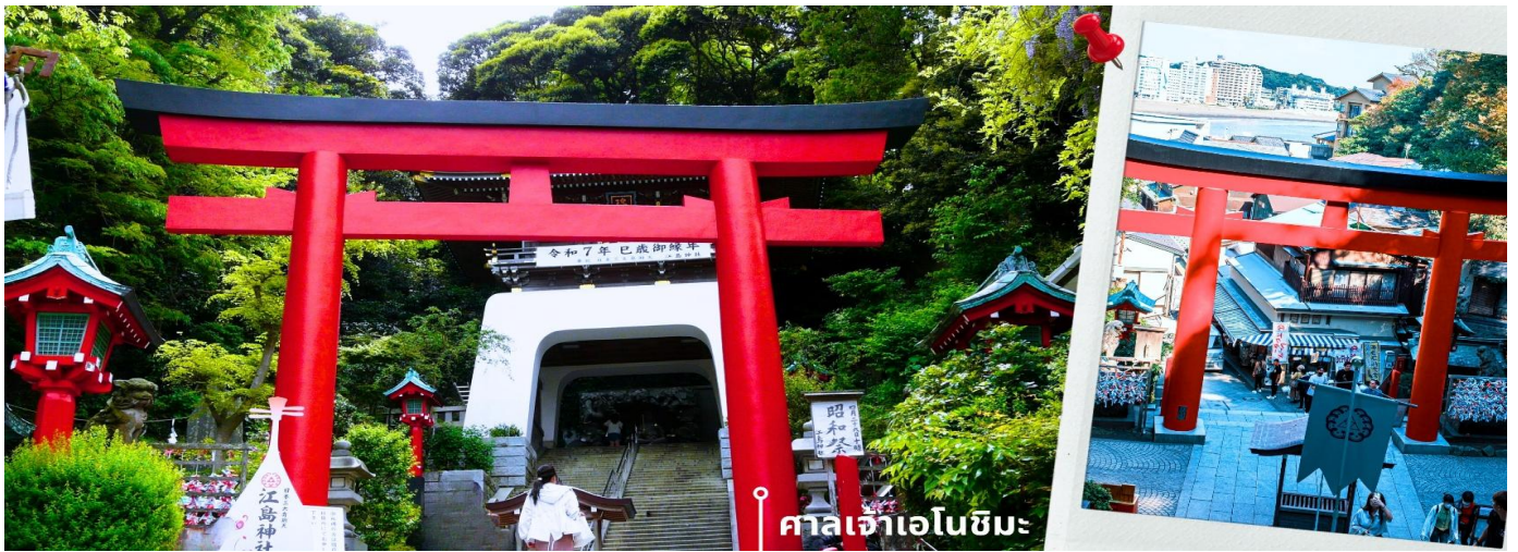
ศาลเจ้าเอโนชิมะ

จากนั้นนำท่านสักการะ ศาลเจ้าเอโนชิมะ ศาลเจ้าศักดิ์สิทธิ์ที่ตั้งอยู่บนเนินเขาของเกาะ โดดเด่นด้วยบันไดทางขึ้นที่ทอดยาวผ่านซุ้มประตูโทริอิและอาคารศาลเจ้าหลายจุดเรียงต่อกัน ภายในประดิษฐานเทพเบนไซเท็น เทพแห่งโชคลาภ ศิลปะ และความสำเร็จ บรรยากาศโดยรอบเงียบสงบ รายล้อมด้วยธรรมชาติ เหมาะสำหรับการขอพรและสัมผัสวัฒนธรรมญี่ปุ่นแบบดั้งเดิม