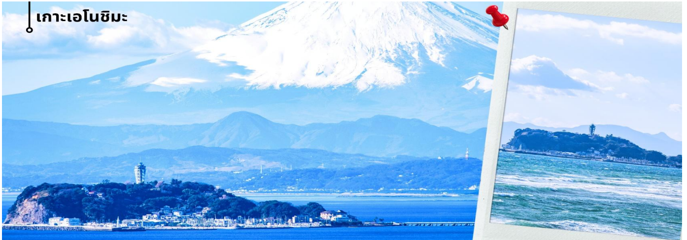
เกาะเอโนชิมะ

เช้า รับประทานอาหารเช้าที่ โรงแรม (3) หลังรับประทานอาหารเช้า นำท่านแวะชม พิพิธภัณฑสถานแผ่นดินไหว เป็นพิพิธภัณฑที่แสดงถึงผลกระทบจากภัยพิบัติแผ่นดินไหวและการระเบิดของภูเขาไฟ ภายในพิพิธภัณฑมีห้องจัดแสดงข้อมูลการประทุของภูเขาไฟจากทุกมุมโลก โชนความรู้ต่างๆและโซนข้อป้ังสินค้าญี่ปุ่นอาทิเช่น ผลิตภัณฑ์เครื่องสำอางและของฝากอีกมากมาย จากนั้นนำท่านเดินทางสู่ เกาะเอโนชิมะ ผ่านสะพานเอโนชิมะ เบนเท็น ซึ่งเป็นเส้นทางเชื่อมระหว่างแผ่นดินใหญ่กับตัวเกาะระหว่างทางสามารถชมบรรยากาศของท้องทะเลและวิวชายฝั่งได้อย่างเพลิดเพลิน และในวันที่อากาศแจ่มใสยังสามารถมองเห็นภูเขาไฟฟูจิได้จากระยะไกลอีกด้วย