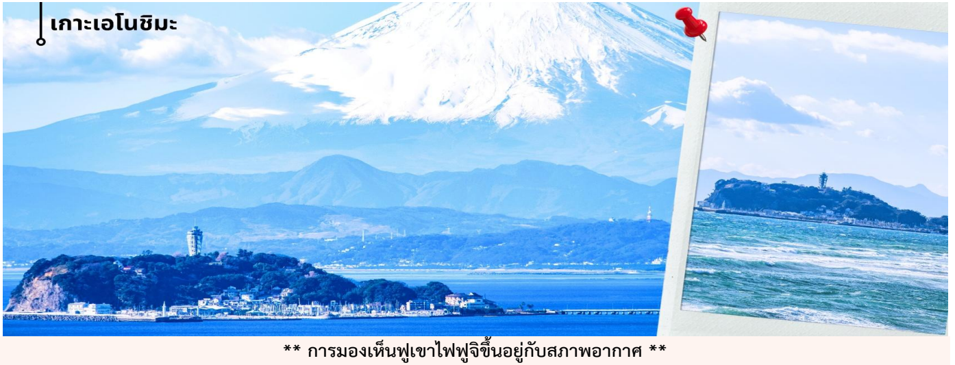
เกาะเอโนชิมะ

เช้า รับประทานอาหารเช้าที่ โรงแรม (3) หลังรับประทานอาหารเช้า นำท่านแวะชม พิพิธภัณฑสถานแผ่นดินไหว เป็นพิพิธภัณฑสถานี่แสดงถึงผลกระทบจากภัยพิบัติแผ่นดินไหวและการระเบิดของภูเขาไฟ ภายในพิพิธภัณฑสถานมีห้องจัดแสดงข้อมูลการประทุของภูเขาไฟจากทุกมุมโลก โชนความรู้ต่างๆและโซนข้อป้ังสินค้าญี่ปุ่นอาทิเช่น ผลิตภัณฑ์เครื่องสำอางและของฝากอีกมากมาย จากนั้นนำท่านเดินทางสู่ เกาะเอโนชิมะ ผ่านสะพานเอโนชิมะ เบนเท็น ซึ่งเป็นเส้นทางเชื่อมระหว่างแผ่นดินใหญ่กับตัวเกาะระหว่างทางสามารถชมบรรยากาศของท้องทะเลและวิวชายฝั่งได้อย่างเพลิดเพลิน และในวันที่อากาศแจ่มใสยังสามารถมองเห็นภูเขาไฟฟูจิได้จากระยะไกลอีกด้วย