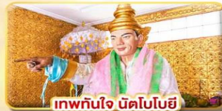
เทพทันใจ นัตโบโฮย