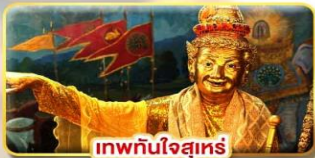
เทพทันใจสุเหร่า

โรงแรม เมืองย่างกุ้ง หรือเทียบเท่า 5 ดาว