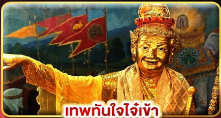
เทพทันใจใจเจ้า

สักการะพระสุพรรณกัลยา ขอพรเทพทันใจ 5 องค์ที่ศักดิ์สิทธิ์ที่สุด