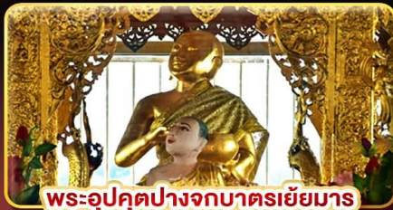
พระอุปคุตปางจกบาตรเขี่ยมาร