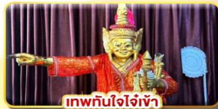
เทพทันใจใจเฝ้า