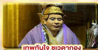
เทพทันใจ ชเวดากอง